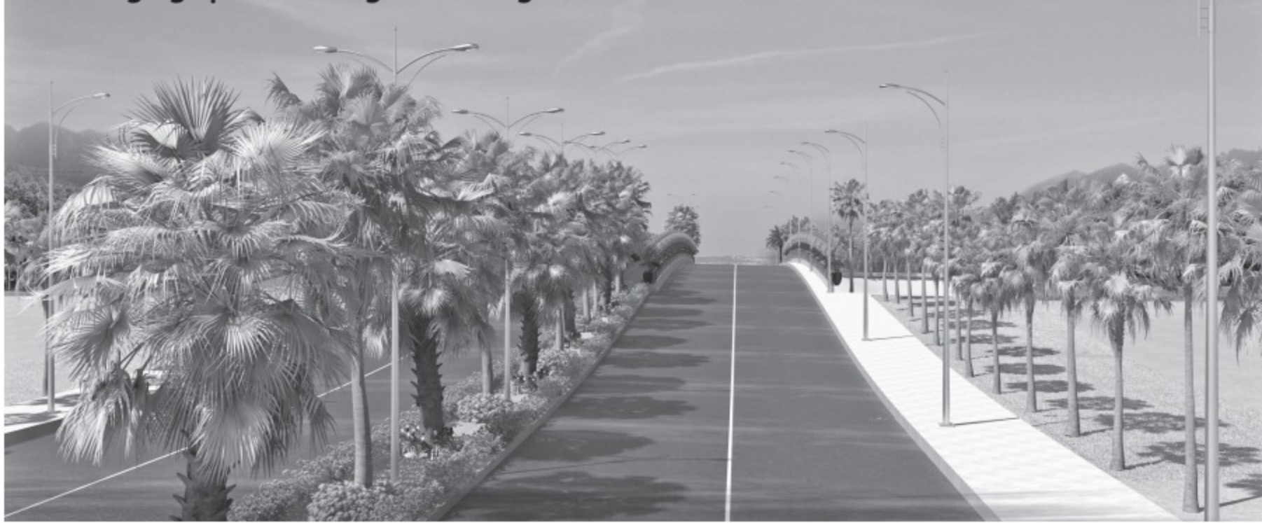
Phối cảnh 3D cầu dẫn vào Khu công nghệ Môi trường xanh Long An

Dự án đã bắt đầu vận hành và đang được bộ phận kỹ thuật theo dõi. Tín hiệu tích cực là ngày càng tốt hơn. Chúng tôi đang thương thảo với Tập đoàn điện lực VN - EVN để bán điện. Sẽ có 12 tổ máy (đang vận hành 4 tổ) được vận hành tại đây. Nhà máy đốt rác phát điện theo công nghệ Nhật Bản trong tương lai cũng nối kết vào đây. Từ đó, chúng ta có thể sử dụng hết nguồn điện có được, phần dư sẽ đưa vào nguồn điện quốc gia nên không có sự xung đột giữa 2 dự án này. ♡