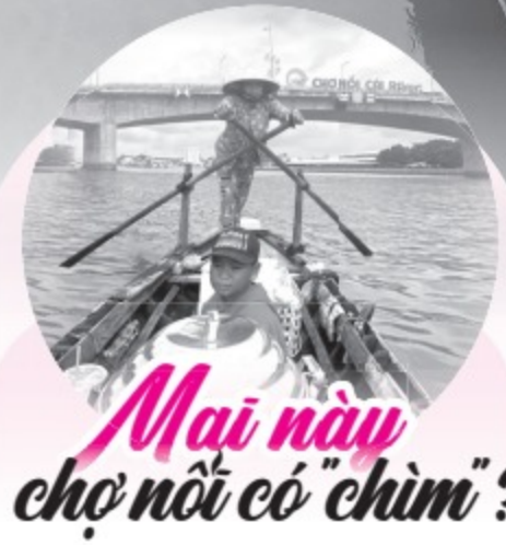
Mai này chợ nổi có "chìm"?