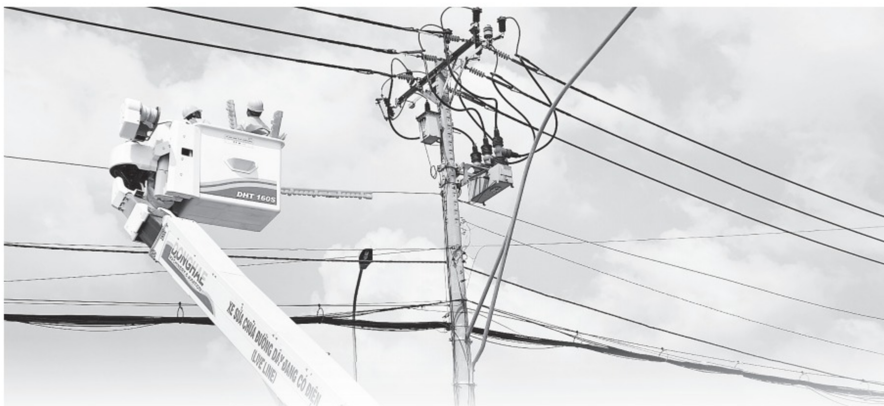
Nhân viên Tổng công ty điện lực TP.HCM khắc phục sự cố điện lưới do quá tải.

Nhà thành phố không thể trở cửa sổ, tôi làm giếng trời cho ánh sáng và gió len lỏi khắp nhà. Sân và ban công trồng rau, vừa có thực phẩm sạch hằng ngày vừa đỡ nóng. Trên mái gắn tấm năng lượng mặt trời. Dưới mái thêm lớp cách nhiệt, mặt ngoài