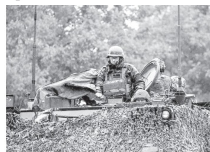
Binh sĩ Ukraine trên xe bọc thép hiện diện ở Zaporizhzhia gần đây

“Cuộc tấn công của Ukraine sẽ kết thúc vào tháng 8 và cả hai bên sẽ ổn định bằng một cuộc giao tranh dọc theo chiến tuyến kèm theo việc mỗi bên tiến hành các cuộc tấn công vào các khu vực phía sau của nhau