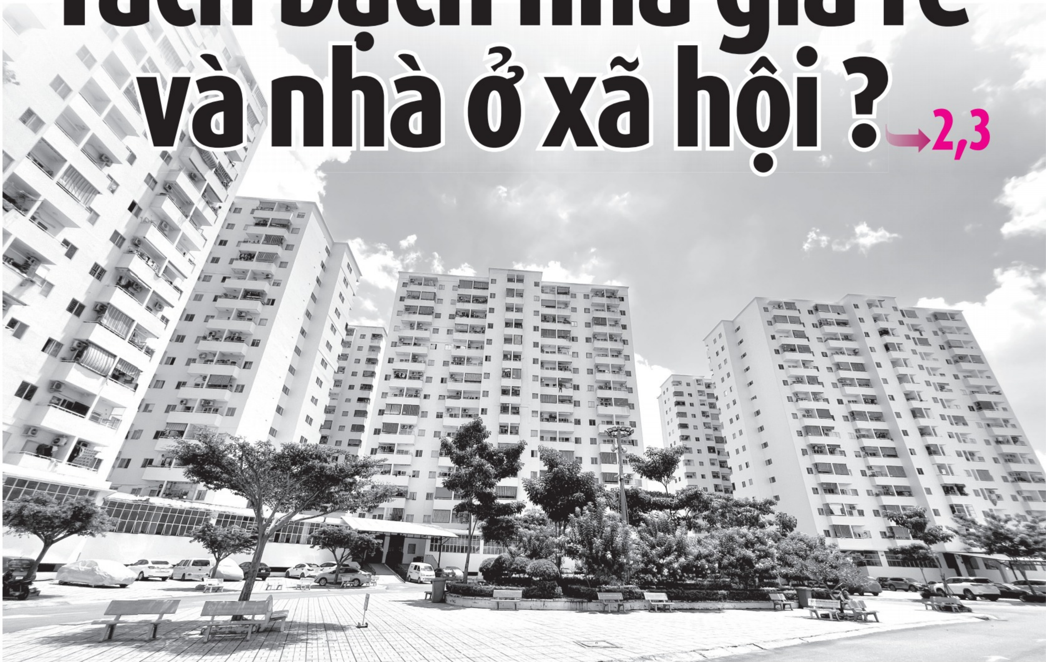
Một dự án nhà chung cư giá rẻ ở Q.Bình Tân, TP.HCM