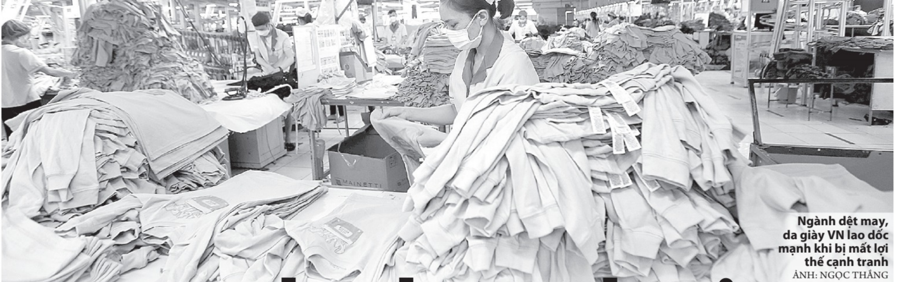
Ngành dệt may, da giày VN lao dốc mạnh khi bị mất lợi thế cạnh tranh