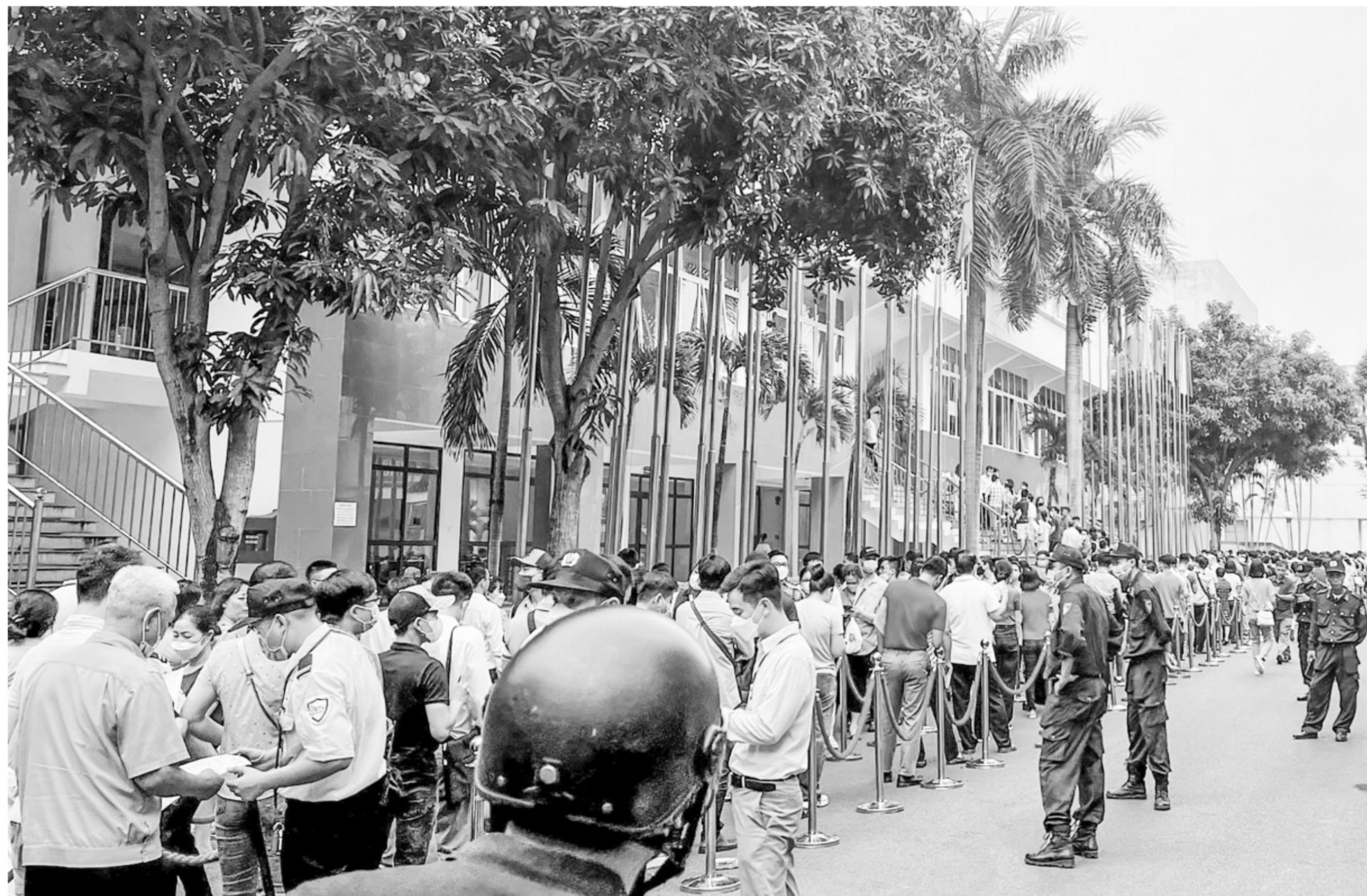
Người dân xếp hàng từ 7 giờ sáng để được vào bốc thăm mua nhà ở xã hội tại Hà Nội vào tháng 5

ĐB Hiến cũng chỉ rõ 2 vướng mắc chính. Theo đó, dự thảo đang cố gắng bảo đảm cho người có thu nhập thấp và đối tượng chính sách được hưởng sở hữu NOXH thay vì bảo đảm cho người dân có quyền có chỗ ở hợp pháp. Nhưng thực tế người có thu nhập thấp, nhất là tại các đô thị, chủ yếu là công nhân, người mới đi làm có thu nhập thấp hơn mức trung bình. “Trong khi nhà ở là tài sản quá lớn, quá sức với đại bộ phận người có thu nhập thấp, vì vậy, việc mua, sở hữu một căn hộ, dù là nhà ở trả góp cũng là gánh nặng tài chính quá lớn”, ông Hiến nói và lo ngại nếu cứ gán mục tiêu này sẽ dẫn đến hệ quả người dân khai man các điều kiện như thu nhập, diện tích để hưởng lợi mua NOXH giá thấp hoặc người có tiền mượn tên công nhân mua đăng ký dẫn tới đầu cơ, làm cho NOXH không phục vụ đúng đối tượng.