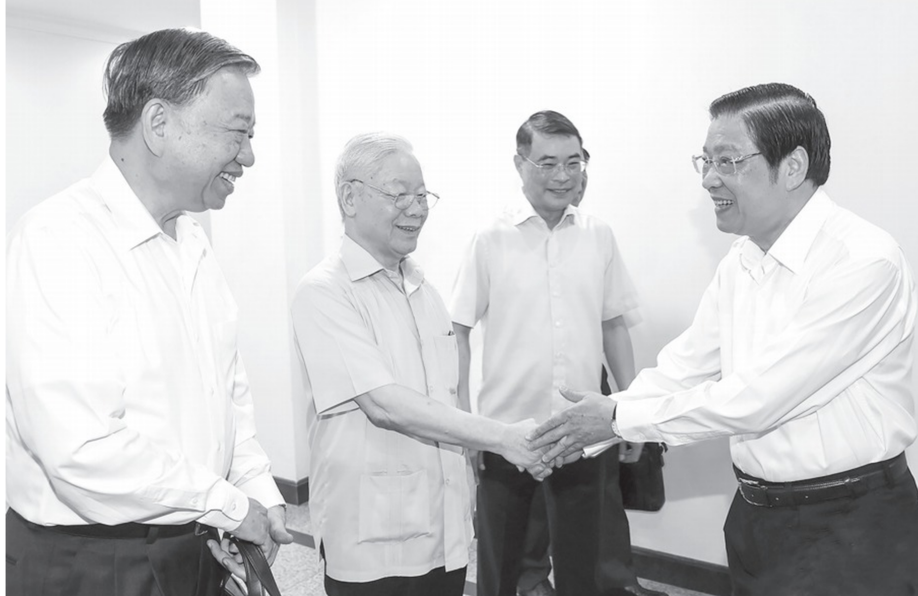
Tổng Bí thư Nguyễn Phú Trọng và các đại biểu dự hội nghị

Bên cạnh đó, Tổng Bí thư cũng cho hay vừa qua, có dư luận băn khoăn vì sao chống tham nhũng, tiêu cực quyết liệt, xử lý nghiêm nhiều cán bộ, đảng viên vi phạm như thế, nhưng vẫn xảy ra một số vụ án tham nhũng, tiêu cực nghiêm trọng, phức tạp, liên quan nhiều cán bộ ở cả T.Ư và địa phương? Dư luận cũng bức xúc trước tình trạng một bộ phận cán bộ, đảng viên, nhất là cán bộ lãnh đạo, quản lý các cấp, làm việc cầm chừng, đùn đẩy, né tránh, sợ sai không dám làm. Ngoài ra là tình trạng những nhiều, gây phiền hà khi giải quyết công việc cho người dân, doanh nghiệp, tức “tham nhũng vặt”, vẫn còn diễn ra.