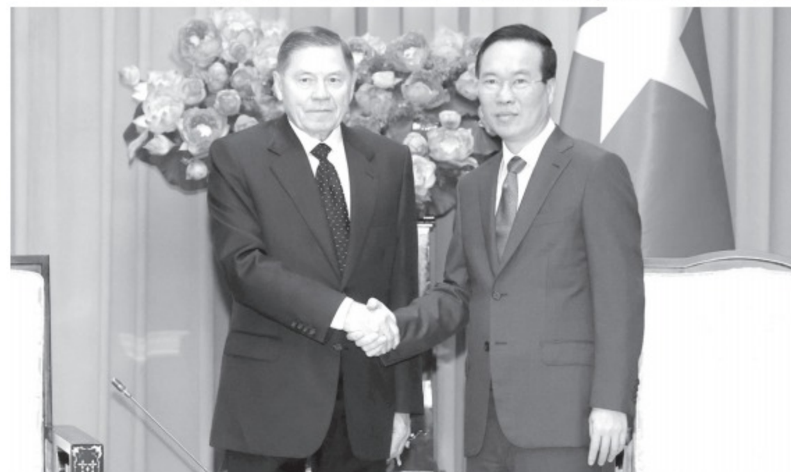
Chủ tịch nước Võ Văn Thưởng tiếp Chánh án Lebedev Vyacheslav Mikhailovich