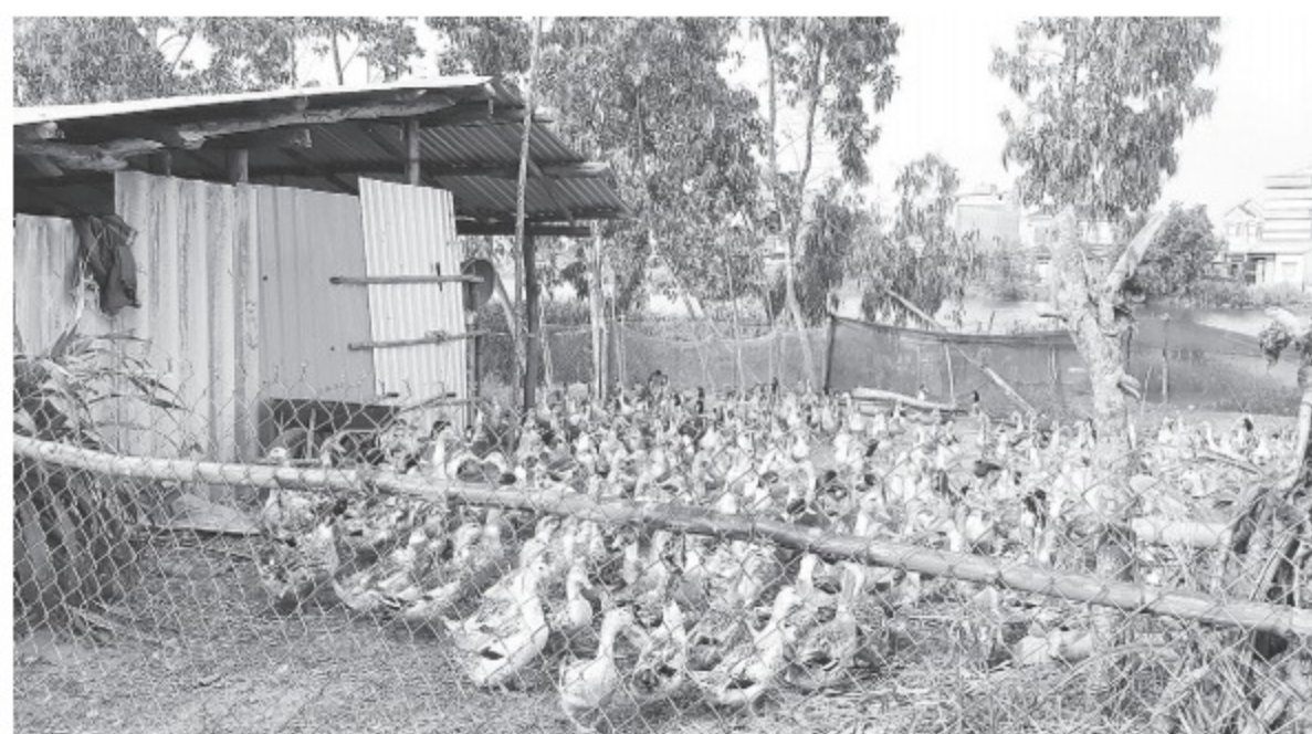
Trại nuôi vịt đã được ông Công chuyển đến địa điểm mới cách địa điểm cũ khoảng 100 m