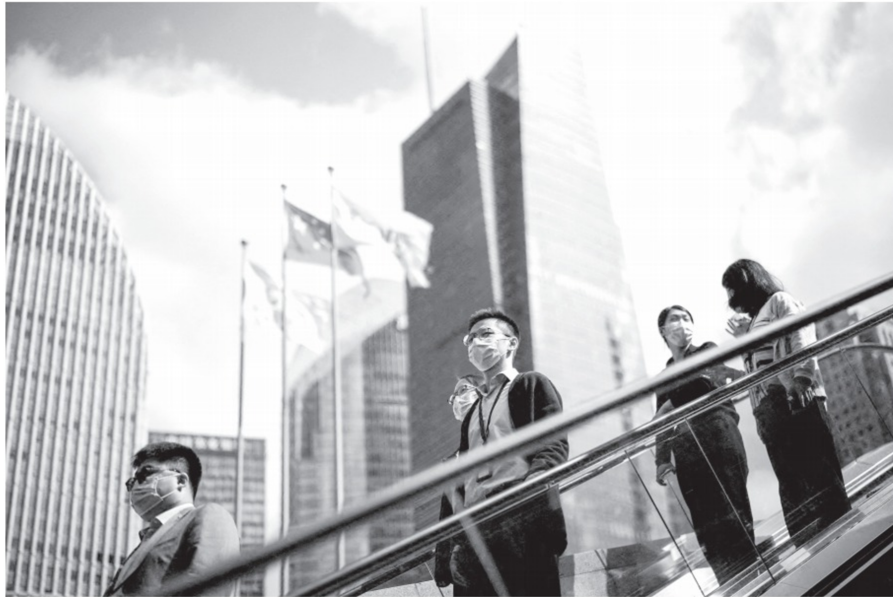
Trung tâm tài chính Lục Gia Chủ ở TP.Thượng Hải, Trung Quốc

Cùng ngày, các thị trường châu Âu cũng xảy ra cảnh tượng tương tự do các nhà đầu tư tiếp tục tâm trạng lo lắng về viễn cảnh kinh tế. Theo Đài CNBC, chỉ số FTSE 100 ở London (Anh) có lúc giảm 0,48% giá trị, DAX (Đức) giảm 0,72%, CAC 40 (Pháp) giảm 0,75%, FTSE MIB (Ý) giảm 0,39%, IBEX 35 (Tây Ban Nha) giảm 0,41%. Bên cạnh đó, chứng khoán trong ngành hóa chất dẫn đầu tình trạng này, giảm