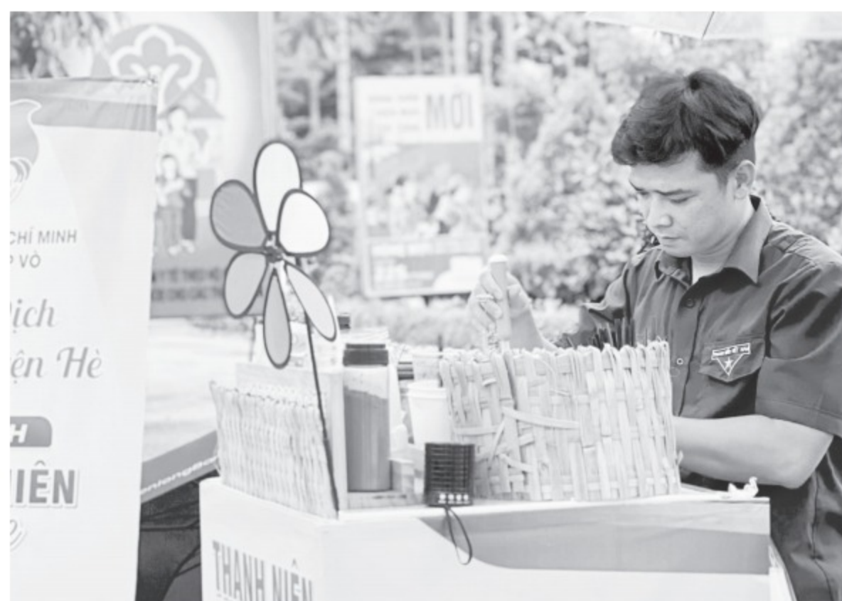
Quầy cà phê gây quỹ giúp đỡ học sinh nghèo của đoàn viên, thanh niên TT.Lấp Vò

Việc hỗ trợ học sinh nghèo đã được Đoàn thanh niên TT.Lấp Vò thực hiện hằng năm. Tuy nhiên, những năm trước chủ yếu là vận động các nhà hảo tâm, còn năm nay đơn vị mở quầy bán cà phê để tự chủ về kinh phí. Để thực hiện mô hình thiện nguyện này, trước hè 1 tháng, các đoàn viên, thanh niên đã tự học pha chế rồi mời người thân, bạn bè dùng thử để đánh giá, rút kinh nghiệm làm ra ly nước ngon nhất đem bán. Số vốn hơn 2 triệu đồng để mua xe, vật dụng và nguyên liệu pha chế do các bạn trẻ tự đóng góp. Quầy cà phê mới vừa đi vào hoạt động giữa tháng 6 nhưng đã được