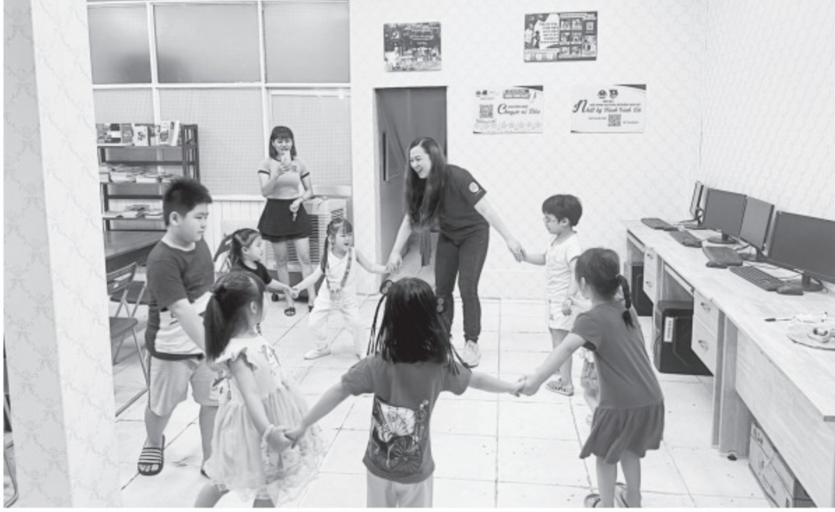
Các hoạt động dạy, học tiếng Anh vui nhộn

“Mình mong lớp học tiếng Anh này không chỉ bổ sung kiến thức ngoại ngữ mà còn là nơi sinh hoạt vui chơi, giúp các con phát triển nhiều kỹ năng xã hội như giao lưu, kết bạn... và có thêm nhiều kỷ niệm tuổi thơ thật đẹp.”