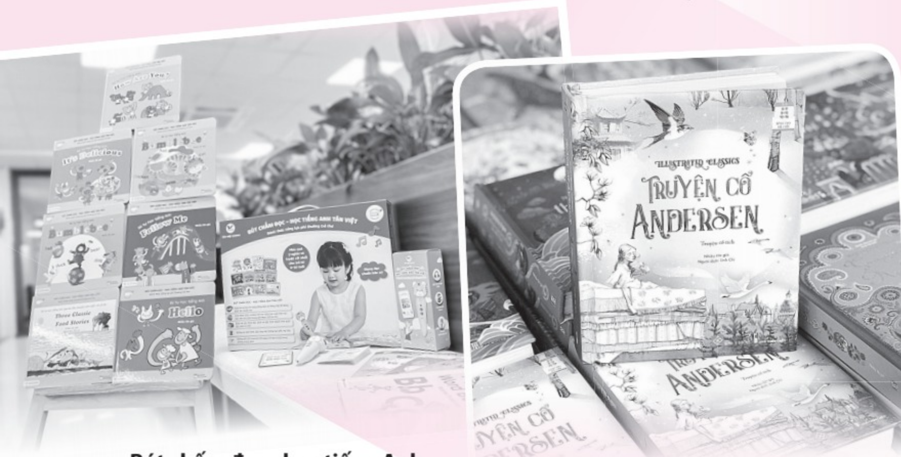
Bút chấm đọc - học tiếng Anh giúp trẻ phát triển đa dạng thính giác, xúc giác và thị giác