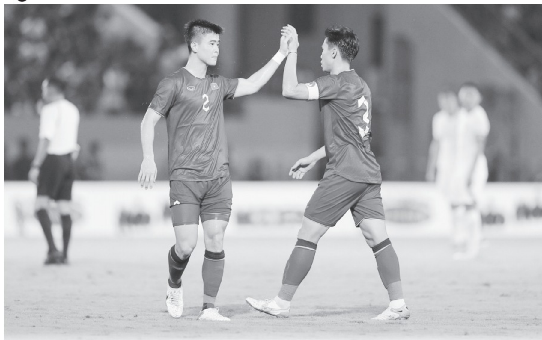
Các trung vệ đội tuyển VN sẽ được thử thách cao độ khi đối đầu với Syria

HLV Troussier chia sẻ: "Mục tiêu của tôi cùng đội tuyển VN là hoàn thiện cách chơi và đấu pháp đã đề ra từ đầu. Để duy trì tập trung tinh thần thì trận nào tôi cũng áp dụng cách làm như trước trận gặp đội Hồng