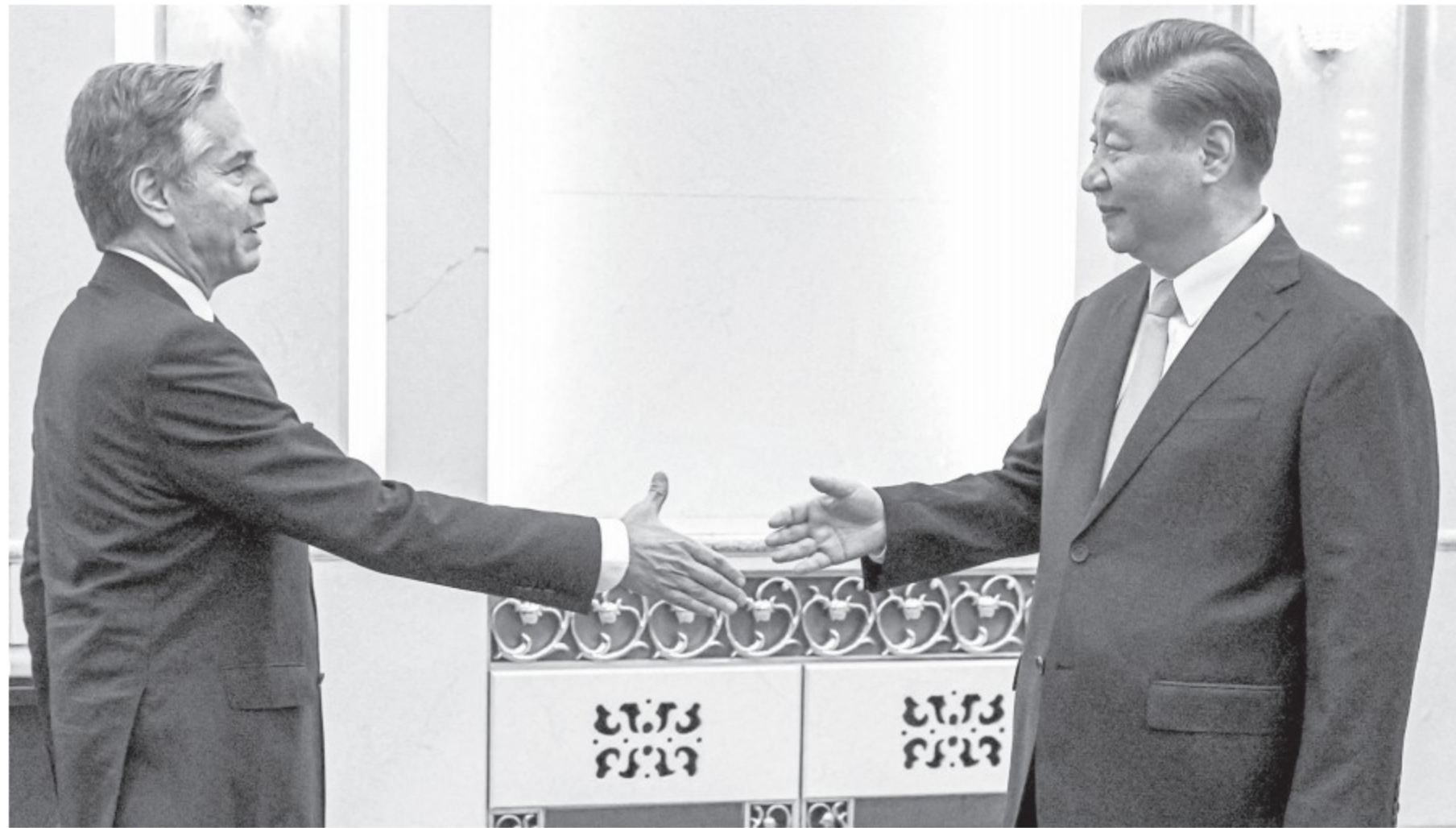
Chủ tịch Tập Cận Bình gặp Ngoại trưởng Blinken ở Bắc Kinh ngày 19.6