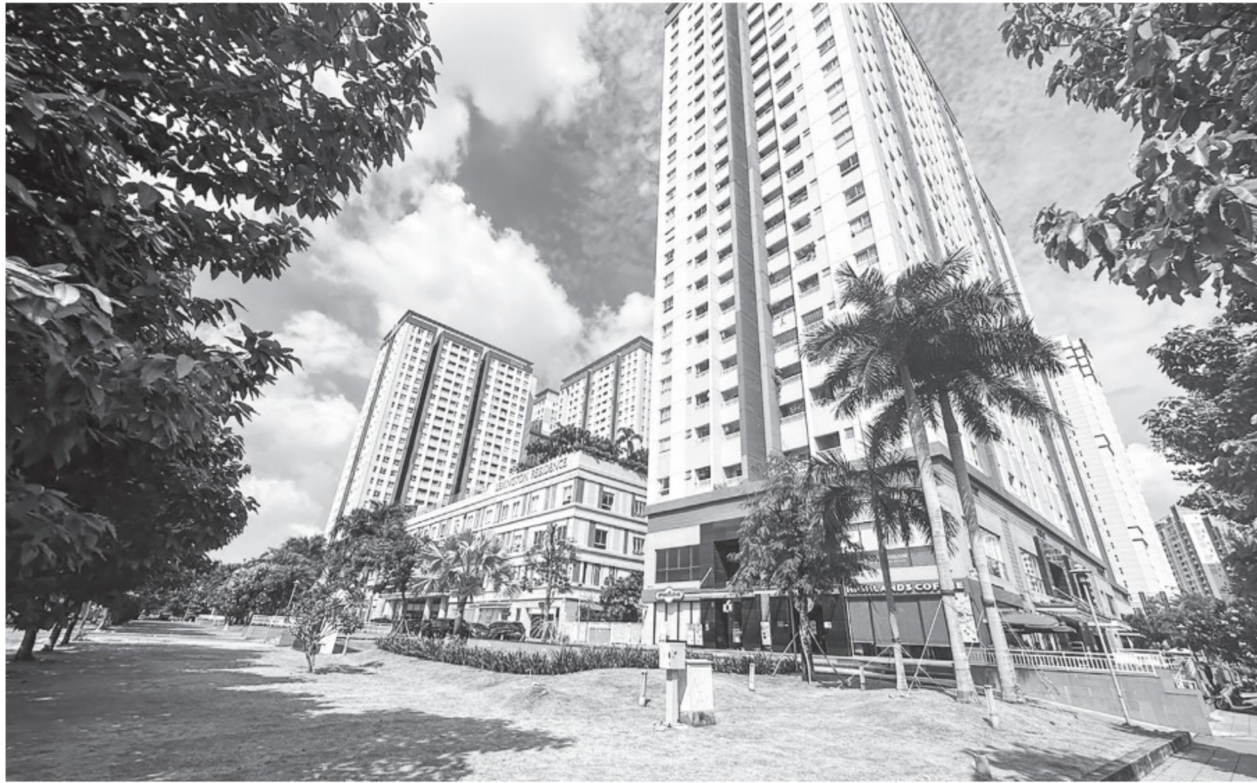
Nhiều nhà đầu tư mua căn hộ để khai thác cho thuê

Hiện nay, đối tượng khách thuê ngày càng phân hóa rõ nét. Đối với phân khúc cao cấp, đối tượng thuê chủ yếu là người nước ngoài, quản lý doanh nghiệp (DN)... Phân khúc trung cấp hướng đến đối tượng nhân viên văn phòng, sinh viên có điều kiện, gia đình có con nhỏ chưa đủ điều kiện mua nhà... Trong khi nhu cầu của các đối tượng này cũng dần thu hẹp và phân bố ở nhiều dự án khác nhau, tiện lợi cho việc di chuyển của họ hơn. Mặt khác, các đối tượng đi thuê chung cư với mức giá trên 10 triệu đồng/tháng chủ yếu là người có thu nhập tốt, dễ thay đổi từ thuê sang mua hẳn căn hộ, nên mức độ ổn định cho thuê của nhà đầu tư không cao. “Hàng năm tại TP.HCM và Hà Nội có khoảng 80.000 căn hộ mới được bán ra thì cũng ngần ấy căn hộ sẽ được bàn giao. Do đó, nguồn cung mới khổng lồ là nguyên nhân chính dẫn đến hoạt động cho thuê căn hộ cạnh tranh gay gắt trên thị trường và nhà đầu tư khó tìm khách thuê. Mức lợi