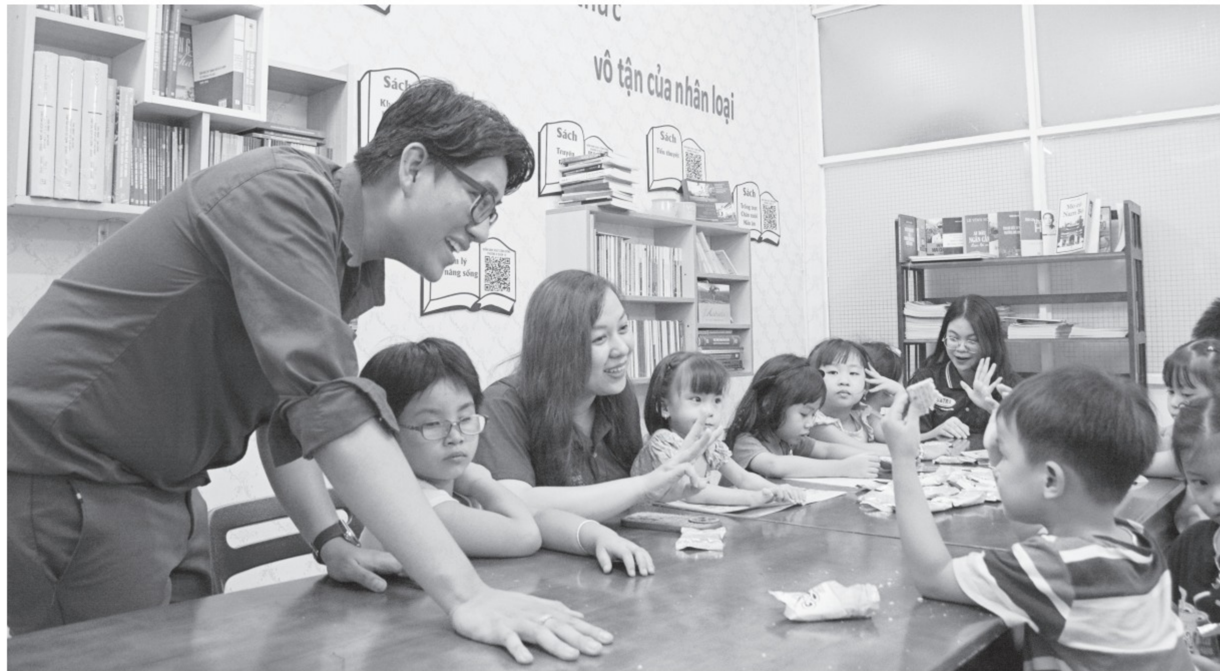
Lớp học tiếng Anh miễn phí của Đoàn P.8, Q.10