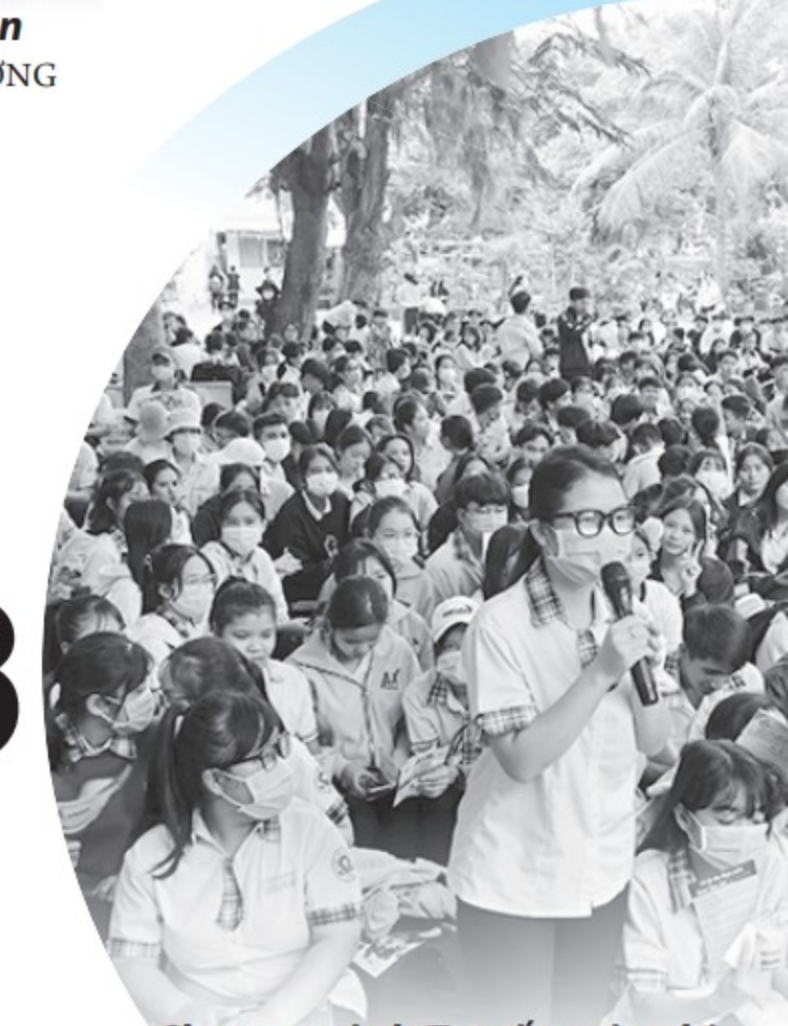
Chương trình Tư vấn mùa thi thu hút đông đảo học sinh tham gia