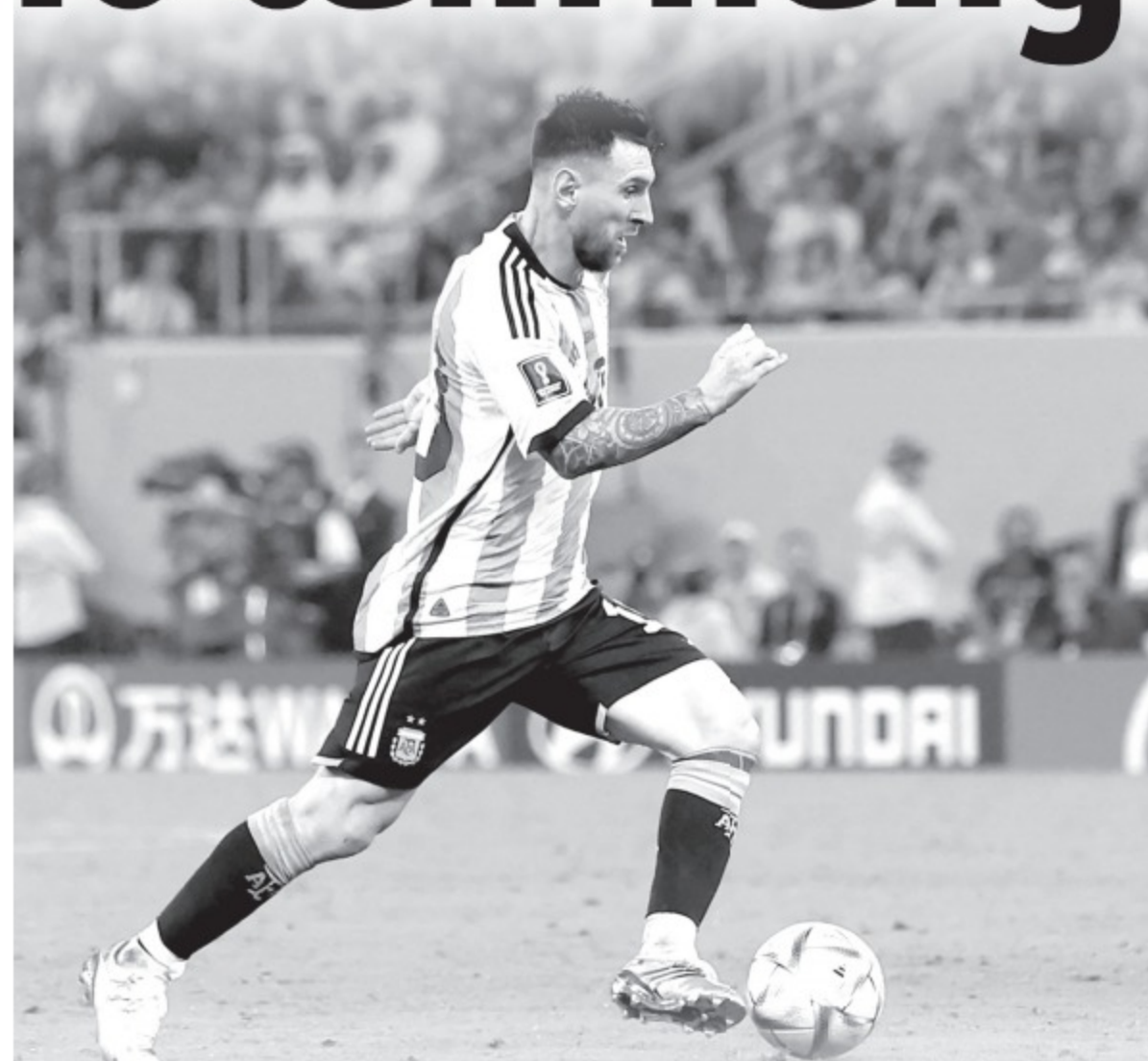
Với sự hiện diện của Messi (phải), tuyển Argentina hầu như luôn được đánh giá cao hơn đối thủ trong bất kỳ trận đấu nào mà họ tham gia

Đúng là rất khó để ngăn cản Messi nhưng cũng đúng khi "Oranje" hiểu rõ là họ còn phải cảnh giác với một số cầu thủ khác của Argentina. Trung vệ Van Dijk nói: "Họ có một đội bóng tốt với nhiều cầu thủ có thể