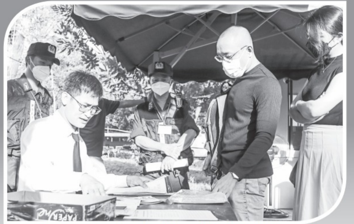
Ngày đầu tiên xét xử vụ án, thêm nhiều bị hại đến tòa án làm thủ tục

Xét xử vụ án Công ty Alibaba lừa đảo bán dự án “ma”