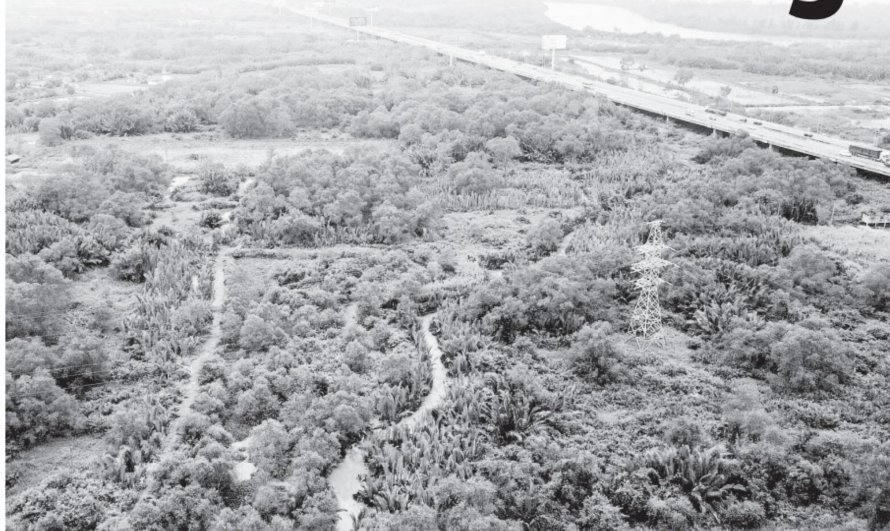
TP.HCM sẽ tập trung bồi thường dự án Vành đai 3 để bàn giao mặt bằng trong tháng 6.2023, đảm bảo tiến độ dự án