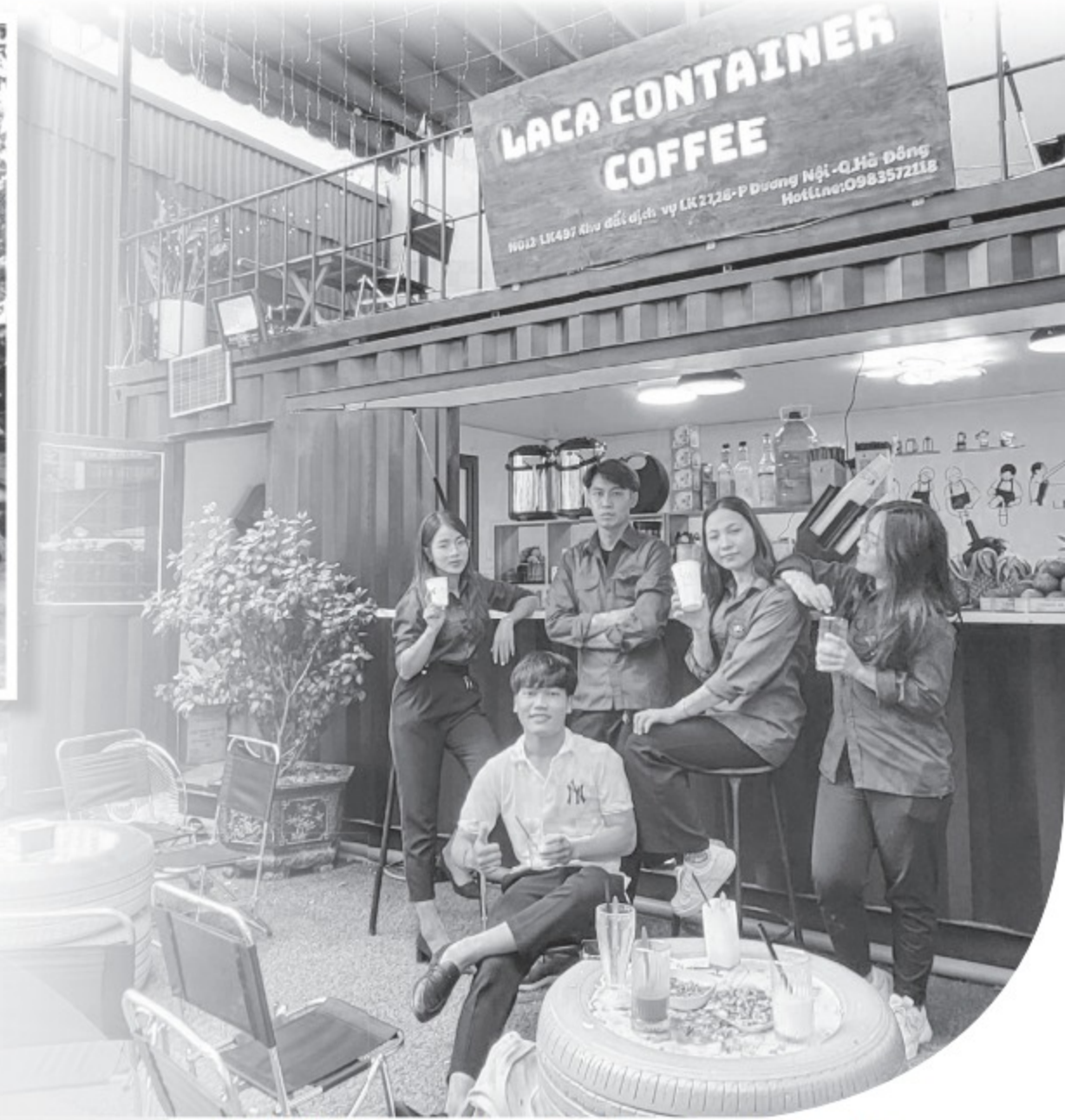
Mô hình Container Coffee của đoàn viên thanh niên Q.Hà Đông đã mang lại hiệu quả kinh tế cho thanh niên