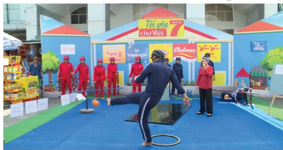
Trò chơi hưởng ứng World Cup

Không hổ danh là người con của miền biển phương Nam, hai đội chơi với tính cách đầy hào sảng và duyên dáng đã có màn giới thiệu mang tính giải trí