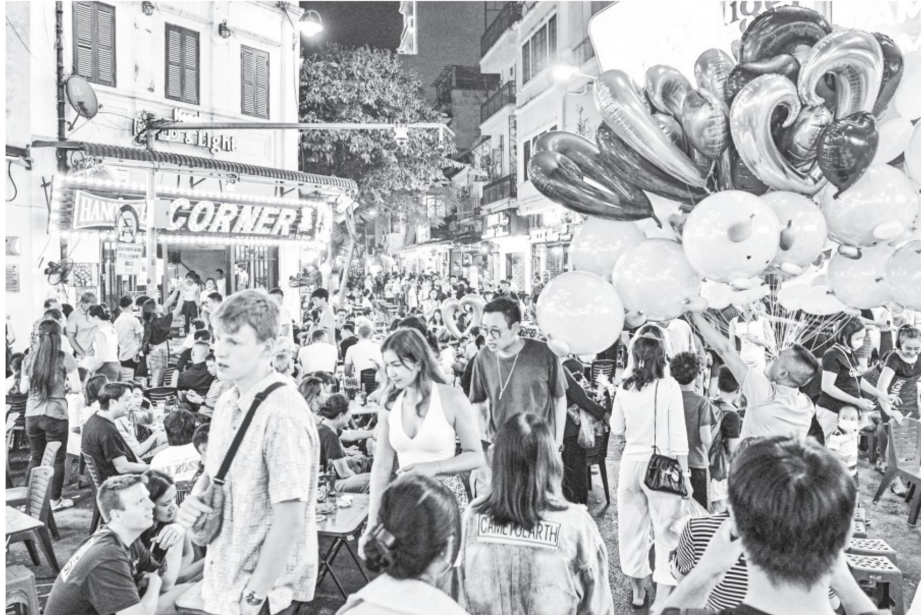
Du lịch Việt vẫn mỗi mòn chờ khách quốc tế quay lại như trước đây