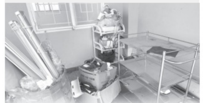
Dụng cụ, vật tư y tế bỏ lại tại cơ sở PTTM trái phép gây chết người

Thường mỗi khi có sự cố chết người xảy ra ở các cơ sở này, dư luận lại quy trách nhiệm cho ngành y tế. Nhưng việc quản lý các cơ sở này không thể không nhắc đến vai trò của chính quyền địa phương, nơi cơ sở đăng ký hoạt động. Ví dụ như Trung tâm thẩm mỹ Key Beauty Center trên đường Nguyễn Trọng Tuyển, P.8, Q.Phú Nhuận (TP.HCM), nơi xảy ra trường hợp cô gái 25 tuổi đến đây thực hiện phẫu thuật thẩm mỹ (PTTM) gặp tai biến và tử vong, vốn chỉ đăng ký hoạt động chăm sóc da, xăm. Năm 2022, quận kiểm tra 2 lần nhưng đều đóng cửa. Khi xảy ra PTTM gây chết người, Sở Y tế xuống phối hợp địa phương kiểm tra thì cơ sở này... đã biến mất.