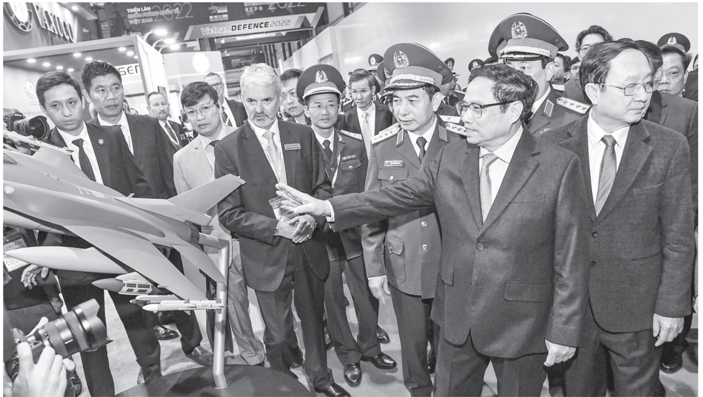
Thủ tướng Phạm Minh Chính tham quan gian hàng của Hãng sản xuất máy bay quân sự Lockheed Martin (Mỹ)

Các biến thể của súng trường STV (như STV 215 hay STV 380) của Nhà máy Z111 có thể tác chiến ở môi trường khắc nghiệt như: nước, cát, nhiệt độ