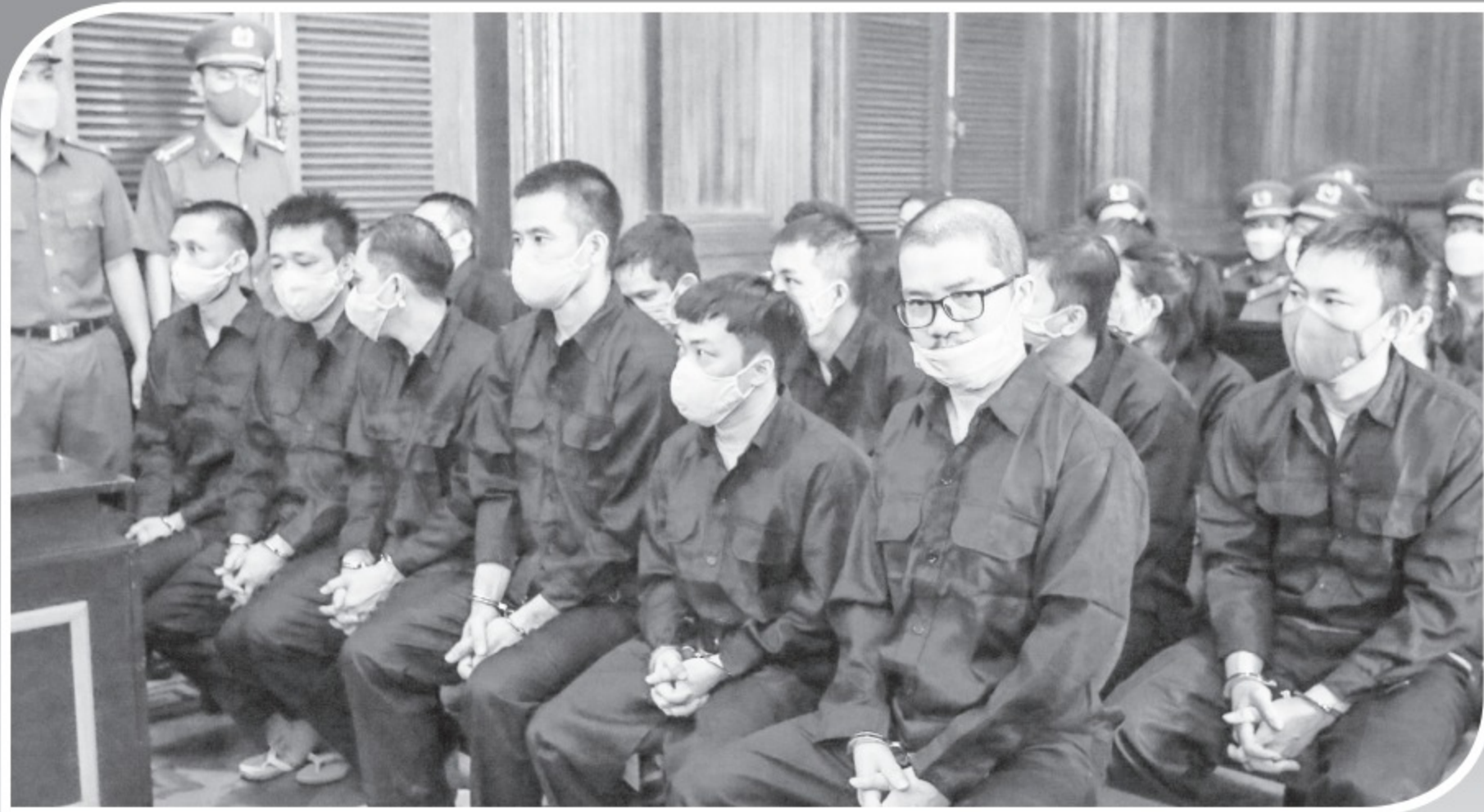
Các bị cáo tại phiên tòa