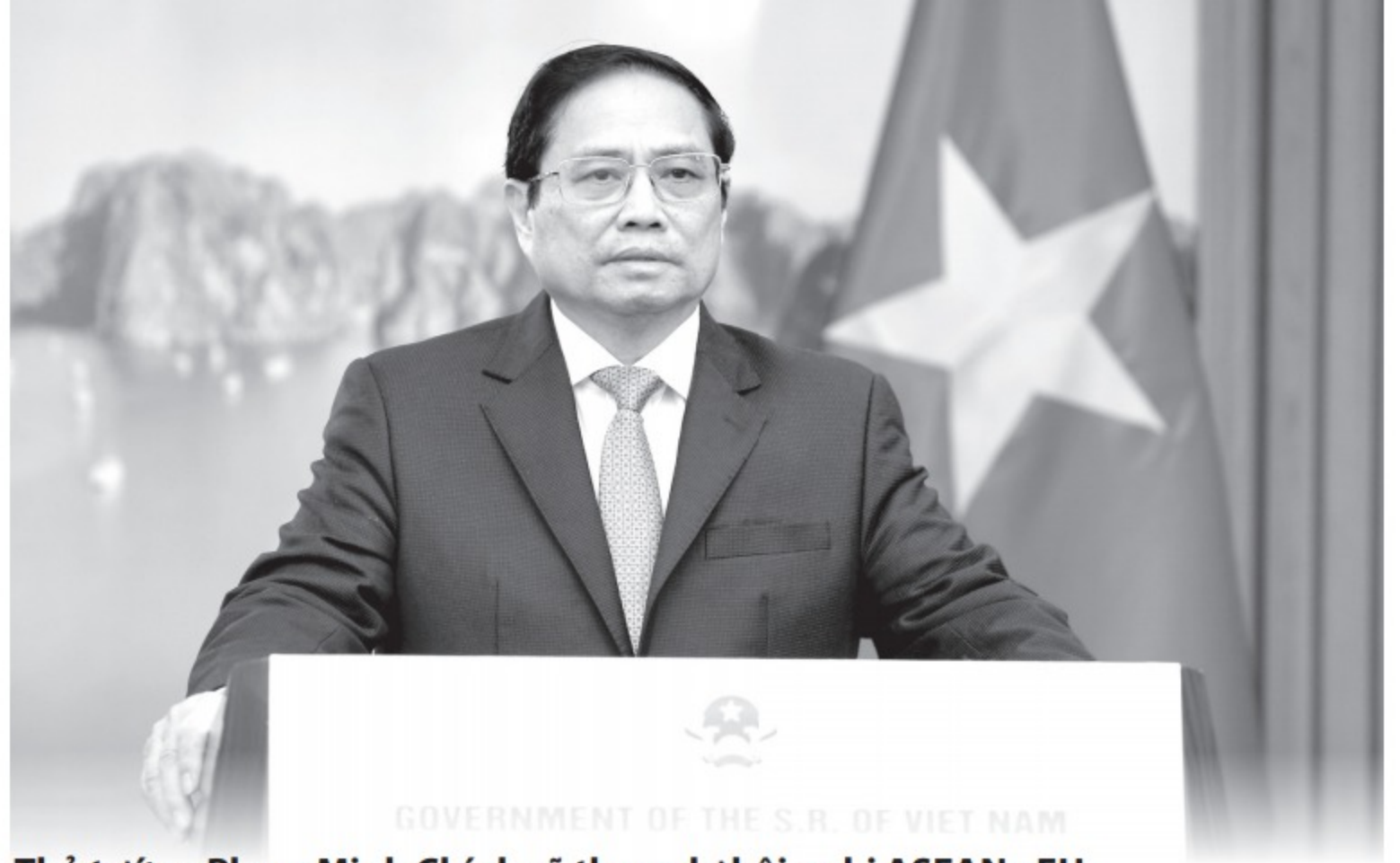
Thủ tướng Phạm Minh Chính sẽ tham dự hội nghị ASEAN - EU và thăm 3 nước châu Âu