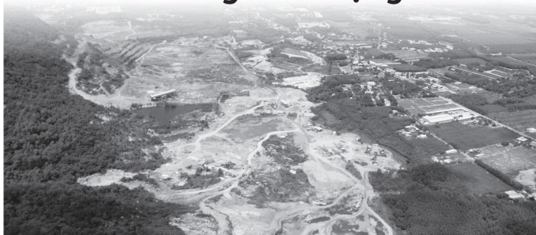
Bà Rịa - Vũng Tàu sẽ bổ sung nhiều mỏ khoáng sản để có vật liệu xây dựng, san lấp thi công các công trình trọng điểm

Tuy nhiên, hiện nay nhiều công trình trên địa bàn tỉnh đang thi công cầm chừng vì thiếu vật liệu san lấp. Những số liệu từ các sở, ngành và địa phương cung