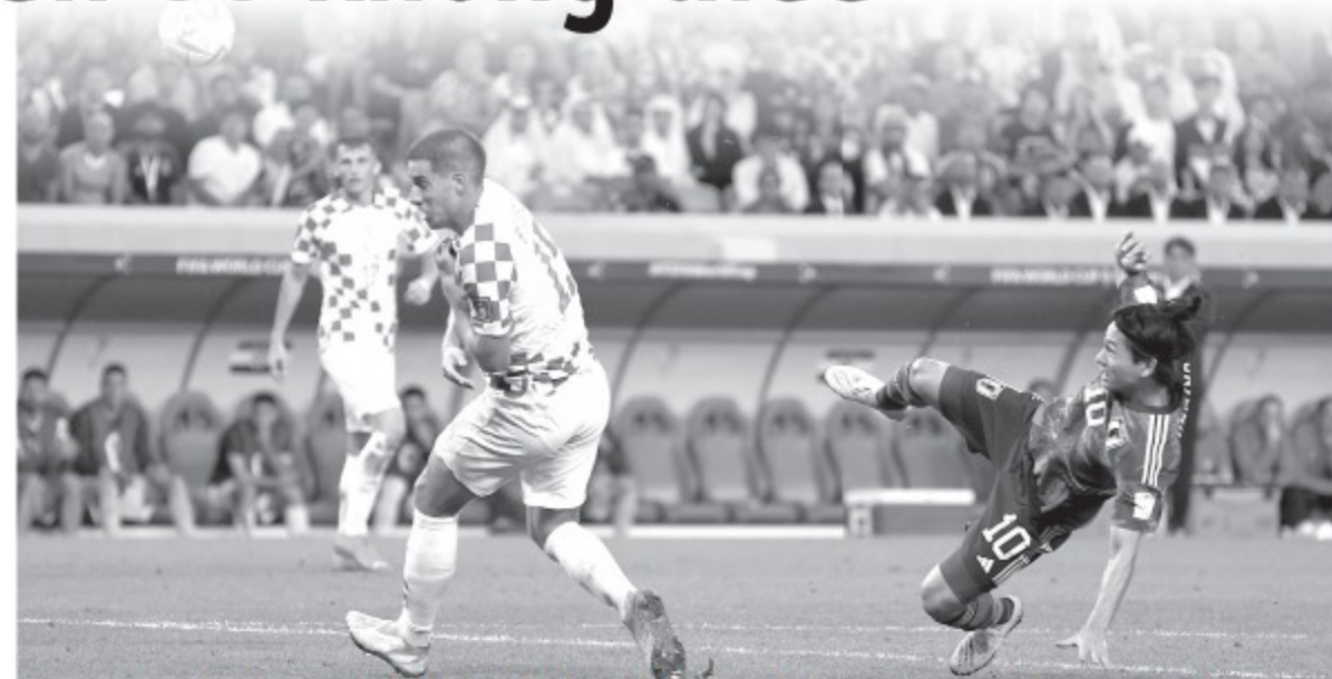
Croatia (trái) tổ chức lối chơi chặt chẽ nên ra sân trước hết là không để thua

Louis Van Gaal từng nói: "Tôi không cần đội Hà Lan đá đẹp, tôi cần chiến thắng nhưng trước hết ra sân để không thua đã. Tôi biết đối thủ như thế nào và chúng tôi muốn gì. Không phải chúng tôi không muốn tấn công gây áp lực mạnh mẽ từ đầu để tìm cách giải quyết trận đấu, nhưng bạn phải nhìn đối thủ mà chơi". HLV Croatia Zlatko Dalic cũng có suy nghĩ tương tự: "Tuy chúng tôi đang trẻ hóa nhưng sức mạnh không thể đồng đều như 4 năm trước, vì vậy cần một lối đá chặt chẽ đặt sự an toàn lên hàng đầu. Kinh nghiệm của các cựu binh sẽ diu dắt các gương mặt trẻ để từng bước vượt qua các đối thủ bằng