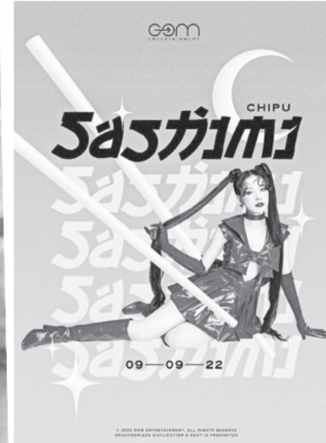
MV Sashimi của Chi Pu