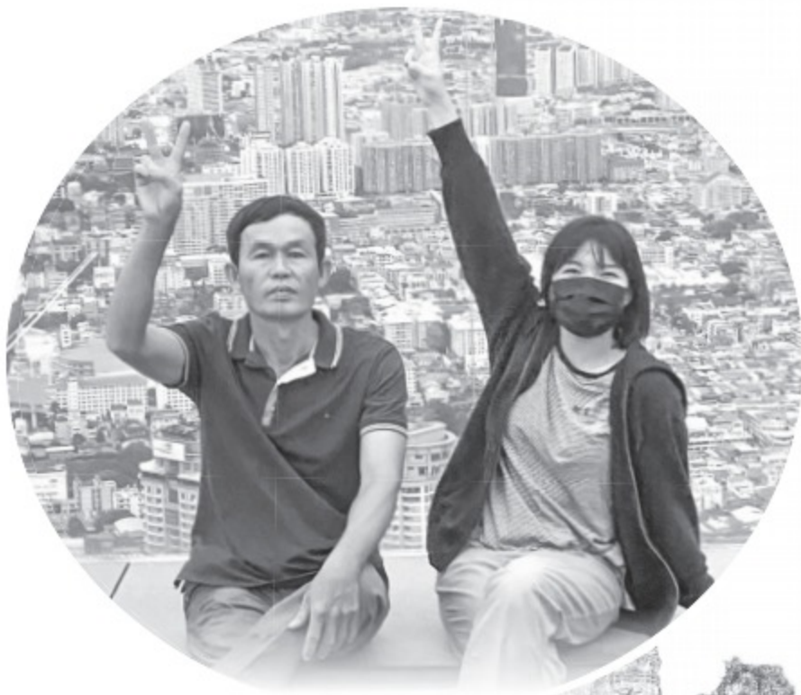
Chị Ngân cùng ba có những trải nghiệm đẹp trong chuyến du lịch