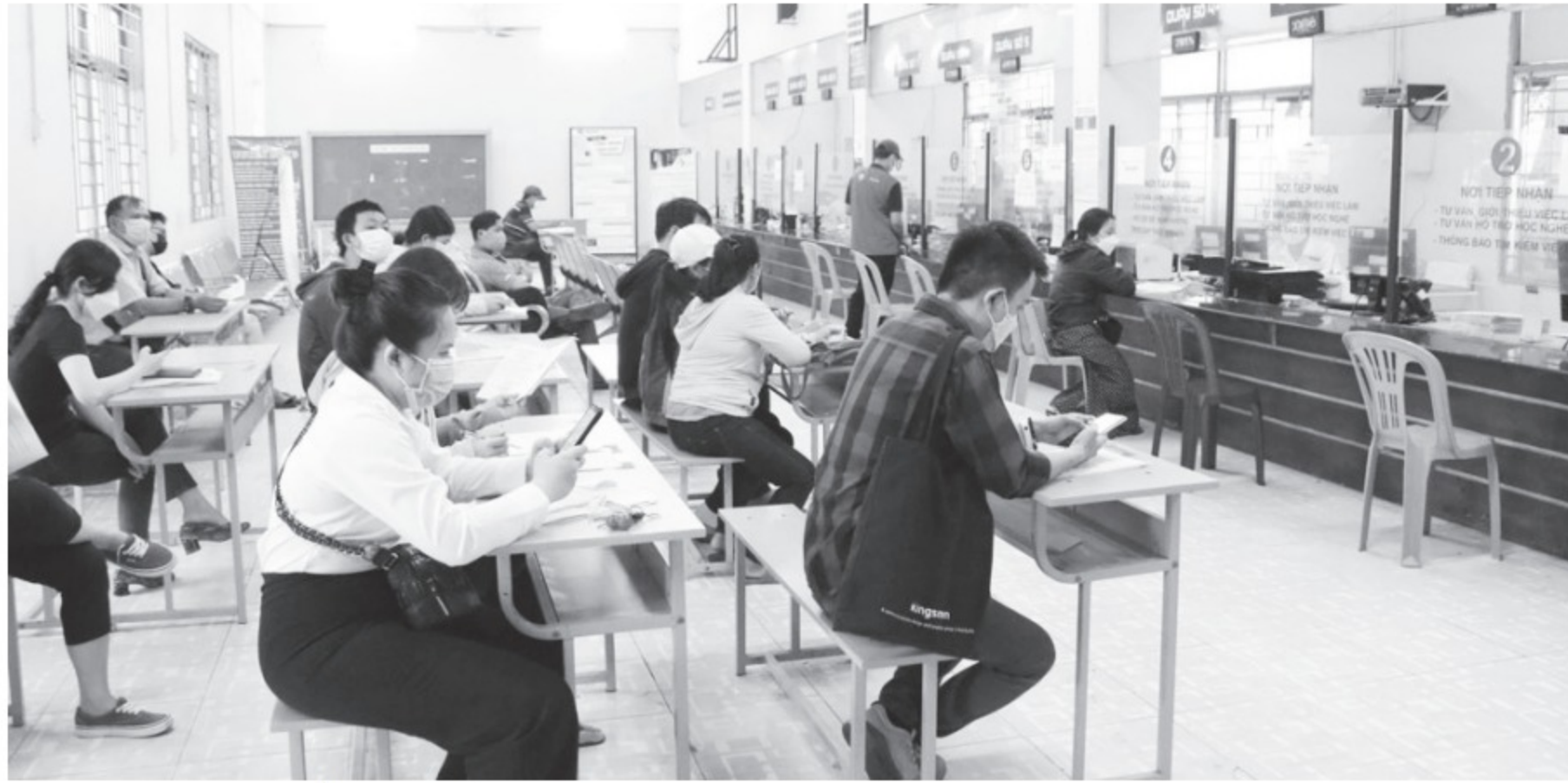
Người lao động đến làm thủ tục tại Trung tâm dịch vụ việc làm TP.HCM

Nếu NLĐ có hợp đồng lao động với nhiều công ty thì NLĐ tham gia BHTN ở công ty đầu tiên. Mức đóng BHTN bằng 2% tiền lương hằng tháng (trong