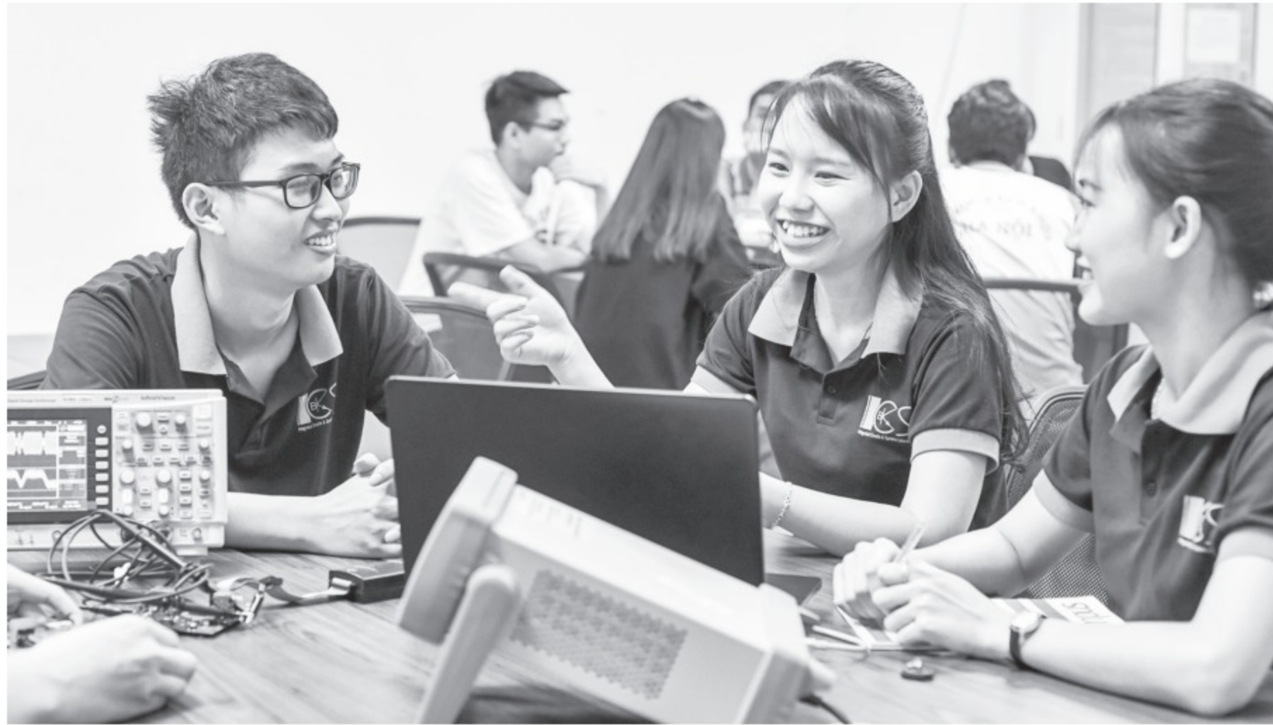
Sinh viên ĐH Bách khoa Hà Nội, trường đầu tiên trở thành ĐH

Ông Sơn nói: “Chúng ta có ĐH Quốc gia Hà Nội từ năm 1995, còn tên gọi ĐH được đưa chính thức vào luật GD ĐH năm 2012, nhưng chỉ có mô hình ĐH 2 cấp (ĐH “con” trong ĐH “mẹ”). Nhưng luật GD ĐH sửa đổi năm 2018 (luật 34/2018) mở rộng định nghĩa về ĐH, không bắt buộc mô hình ĐH phải là 2 cấp. Với luật 34/2018, yêu cầu ĐH chỉ là đa lĩnh vực, có năng lực đào tạo sau ĐH, nghĩa là phải chú trọng nghiên cứu và có khả năng đào tạo người làm