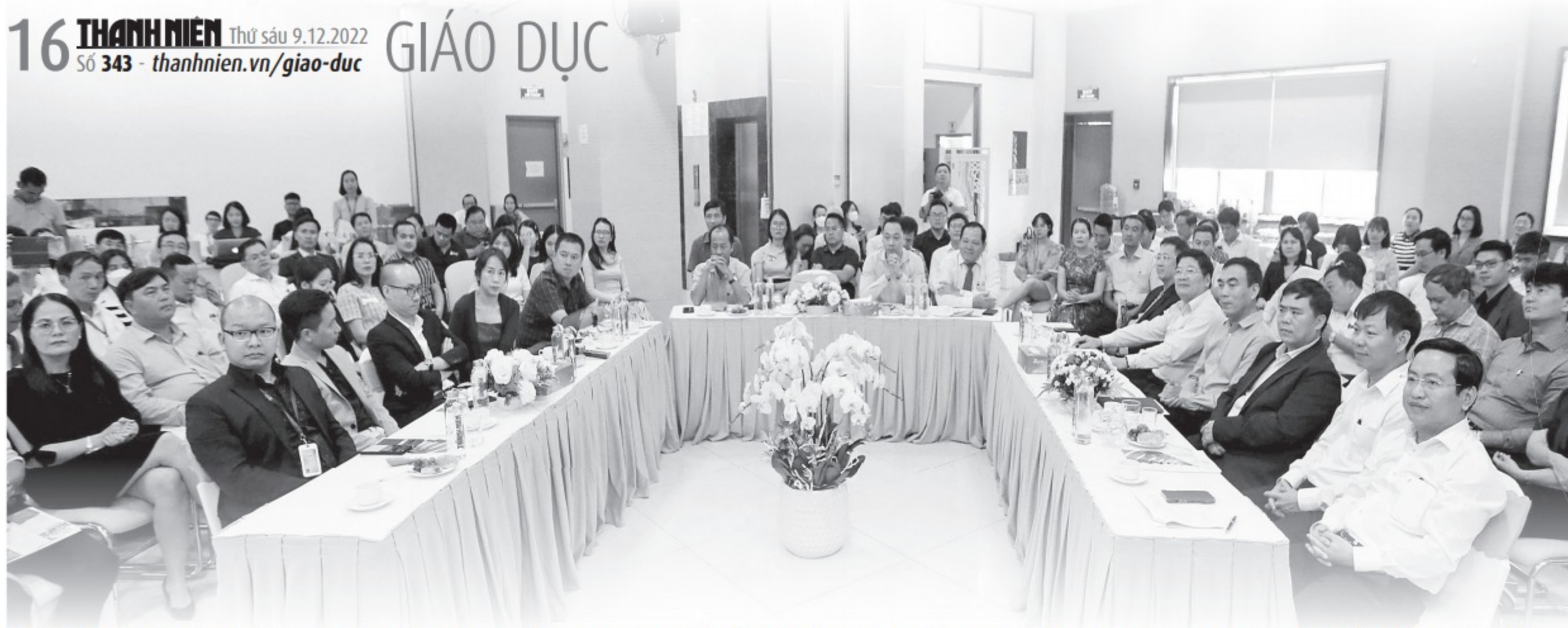
Đại diện các trường, đơn vị giáo dục tham gia buổi gặp gỡ triển khai chương trình Tư vấn mùa thi năm 2023 của Báo Thanh Niên chiều qua 8.12