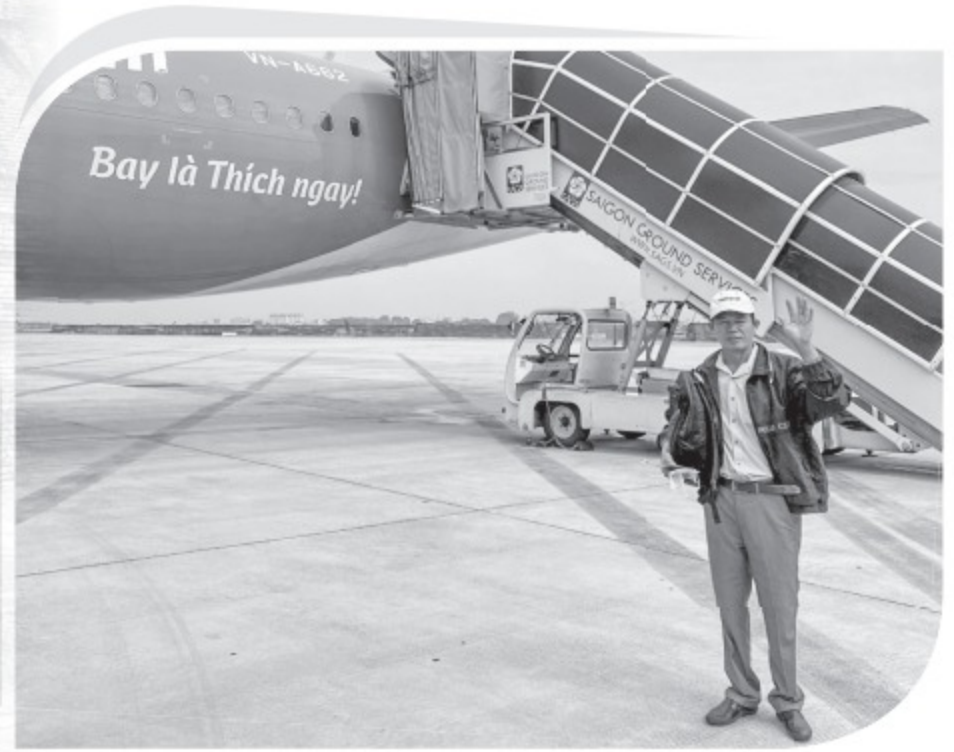
Ông Kiệt thích thú vì lần đầu được đi du lịch, đi máy bay...