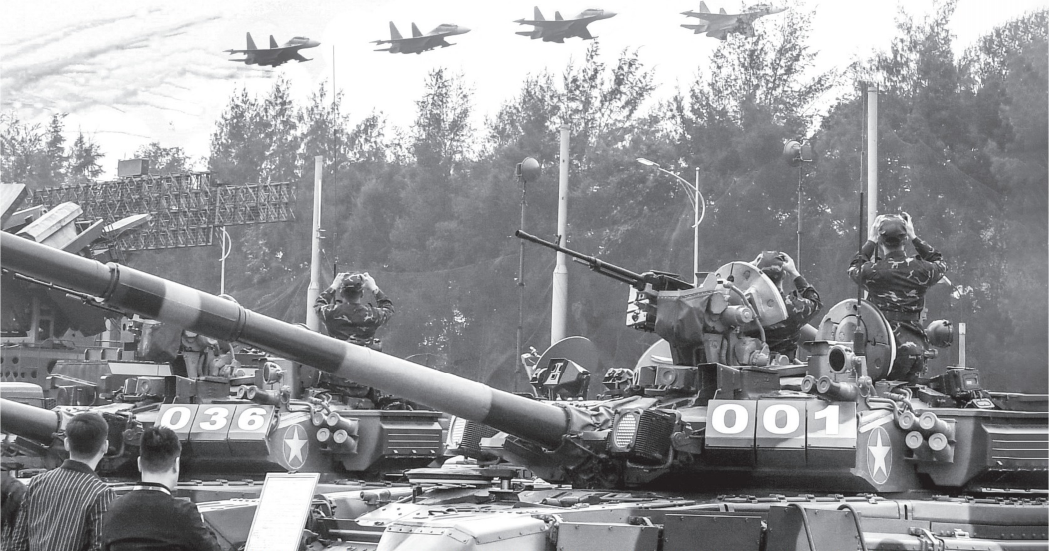
Màn biểu diễn của chiến đấu cơ Su-30 MKII và phía dưới là xe tăng T90, tại Triển lãm Quốc phòng quốc tế VN 2022