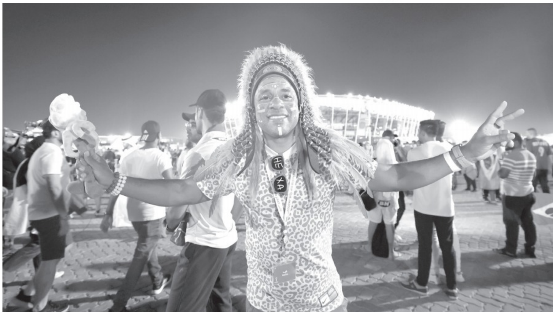
Người Brazil tự tin nhưng vẫn bị ám ảnh bởi Messi khi họ hát bài Messi ciao

Bài hát Messi ciao (Tạm biệt Messi) thực ra có lời khá cũ, vốn đã được hát lên từ World Cup 2018, trong đó nhắc tới một cái tên của quá khứ là “Mascherano” và một cái tên vẫn còn trong đội hình World