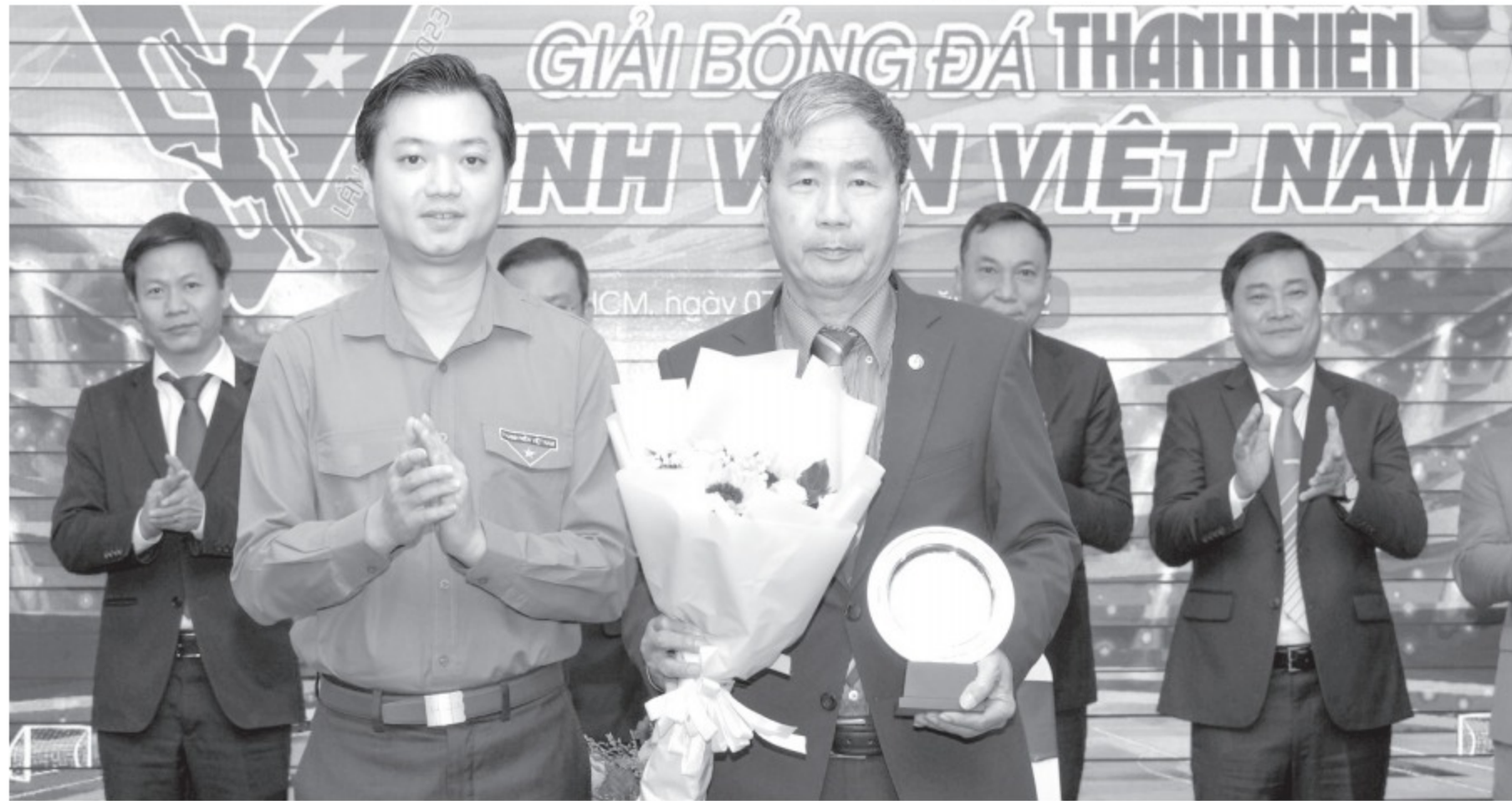
Bí thư T.Ư Đoàn Nguyễn Minh Triết kỳ vọng giải bóng đá Thanh Niên Sinh viên VN tiến tới trở thành một thương hiệu uy tín của Báo Thanh Niên với giới trẻ và xã hội

Bí thư T.Ư Đoàn Nguyễn Minh Triết đánh giá cao sáng kiến và nỗ lực của Ban biên tập Báo Thanh Niên vượt qua khó khăn của đại dịch Covid-19 để tạo ra một sân chơi ý nghĩa cho đông đảo thanh niên và 2,4 triệu sinh viên VN trong và ngoài nước: “Giải bóng đá Thanh Niên Sinh viên VN ra mắt vào thời điểm hết sức đặc biệt quan trọng, khi chỉ còn 1 tuần nữa chúng ta sẽ tổ chức Đại hội Đoàn toàn quốc lần thứ XII. Đây cũng là sự kiện chính trị rất lớn của thanh niên VN, trong đó có sinh viên, khẳng định những phong trào, chương trình, đề án để phát triển thanh niên trong 5 năm tới. Trong các nội dung đó, rèn luyện phát triển thể chất cho thanh niên, sinh viên cũng là một trong những trọng điểm của đại hội. Cũng vào tầm