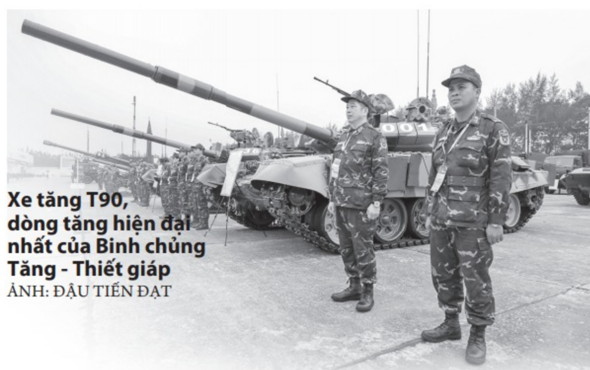
Xe tăng T90, dòng tăng hiện đại nhất của Binh chủng Tăng - Thiết giáp