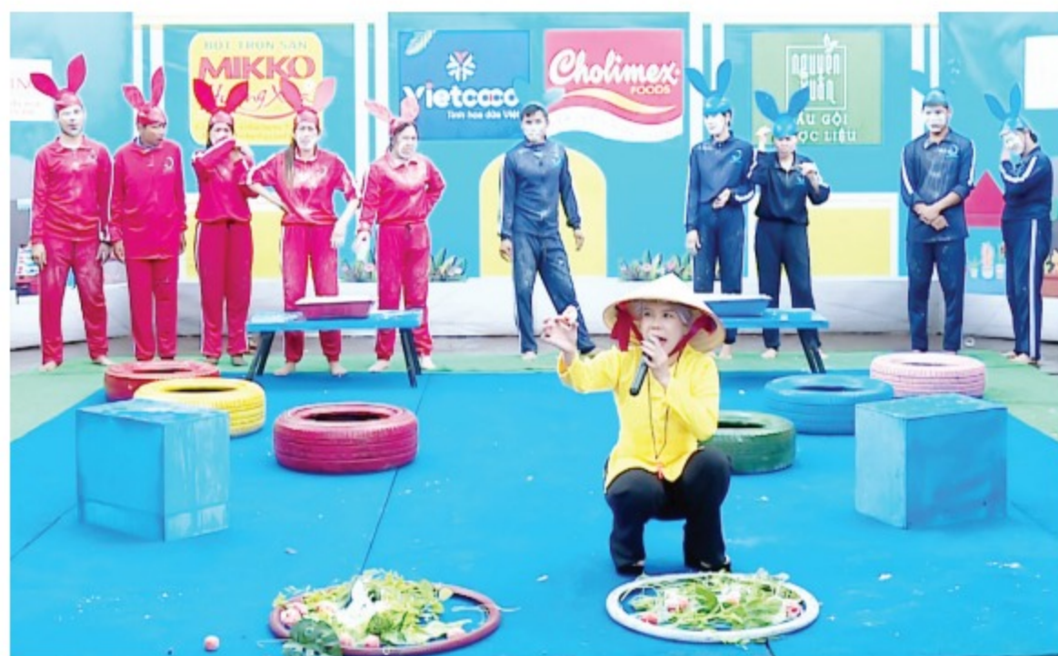
Tiểu thương chợ Đắc Đa (Gia Lai) thi đấu cực sung bất chấp mưa lớn

Trong trò Thỏ trồng cà chua , màn hóa thân thành những chú thỏ lạnh lợi, hoạt bát của các đội chơi khiến Việt Hương cực kỳ khoái chí. Đây cũng là tập chứng kiến không ít khó khăn trong việc ghi hình. Thời tiết Tây nguyên hết mưa rồi lại nắng nhưng ê kíp và khán giả tại chợ Đắc Đa vẫn quyết tâm ghi hình ngay cả lúc trời mưa