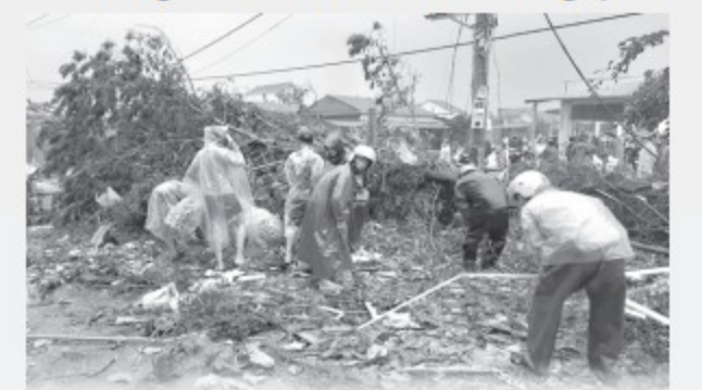
Người dân cùng nhau tìm vàng cho tiệm vàng Phước Thịnh sau cơn lốc