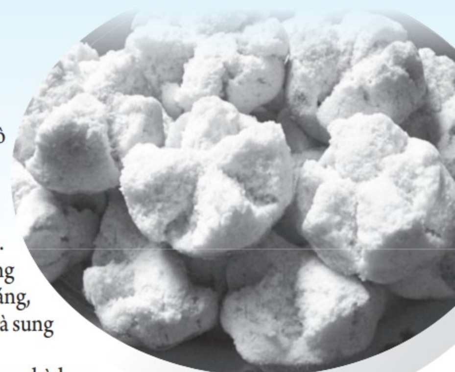
Bánh thuẫn, món ăn quen thuộc của người Quảng ANH: LÊ HỒNG KHÁNH

Hồi đó, do hay sang nhà bạn chơi nên tôi còn học được một cách làm bánh khác từ má của bạn. Đó là bánh thuẫn nhẹ với tỷ lệ bột giảm 20% so với bánh thuẫn nở mọi nhà vẫn hay làm, và bánh phải được làm bằng trứng gà chứ không pha lẫn trứng vịt, chỉ bột mì chứ không