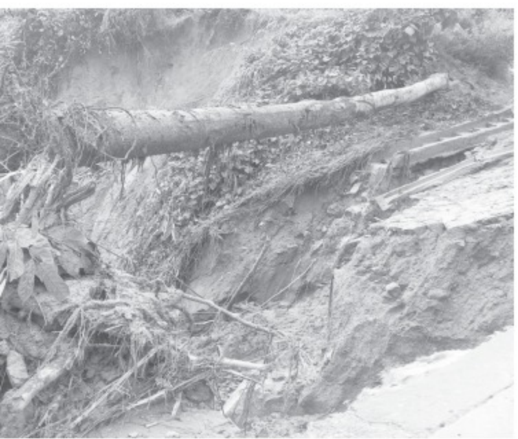
Tuyến QL14D ở Quảng Nam sạt lở nghiêm trọng

Để chủ động ứng phó các đợt mưa lũ sắp tới, hôm qua UBND tỉnh Quảng Nam yêu cầu các chủ hồ chứa thủy điện Sông Bung 4, A Vương, Đak Mi 4 hạ dần mực nước trong hồ, đến trước 19 giờ ngày 6.10 các hồ phải về "cao trình mực nước cao nhất trước lũ" để đảm bảo dung