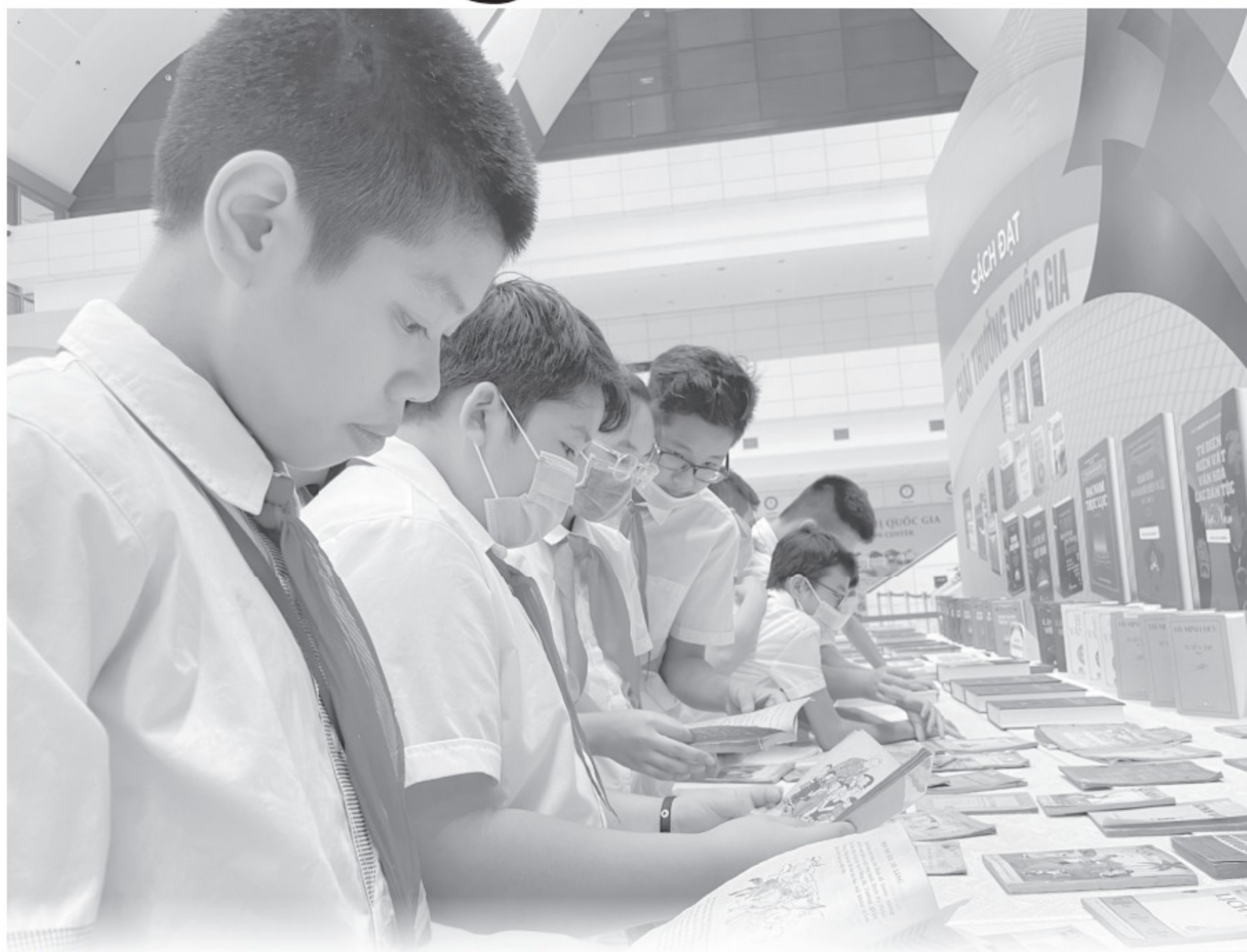
Theo Bộ GD-ĐT, dù khuyến khích các tổ chức, cá nhân tham gia biên soạn SGK nhưng vẫn phải lấy chất lượng là số 1

Do vậy, ông Ái kiến nghị Bộ GD-ĐT, Bộ Tài chính báo cáo Chính phủ để tham mưu với Quốc hội quyết định vấn đề quản lý giá và SGK cho sát với thực tế. Chính phủ chi ngân sách nhà nước cho thư viện