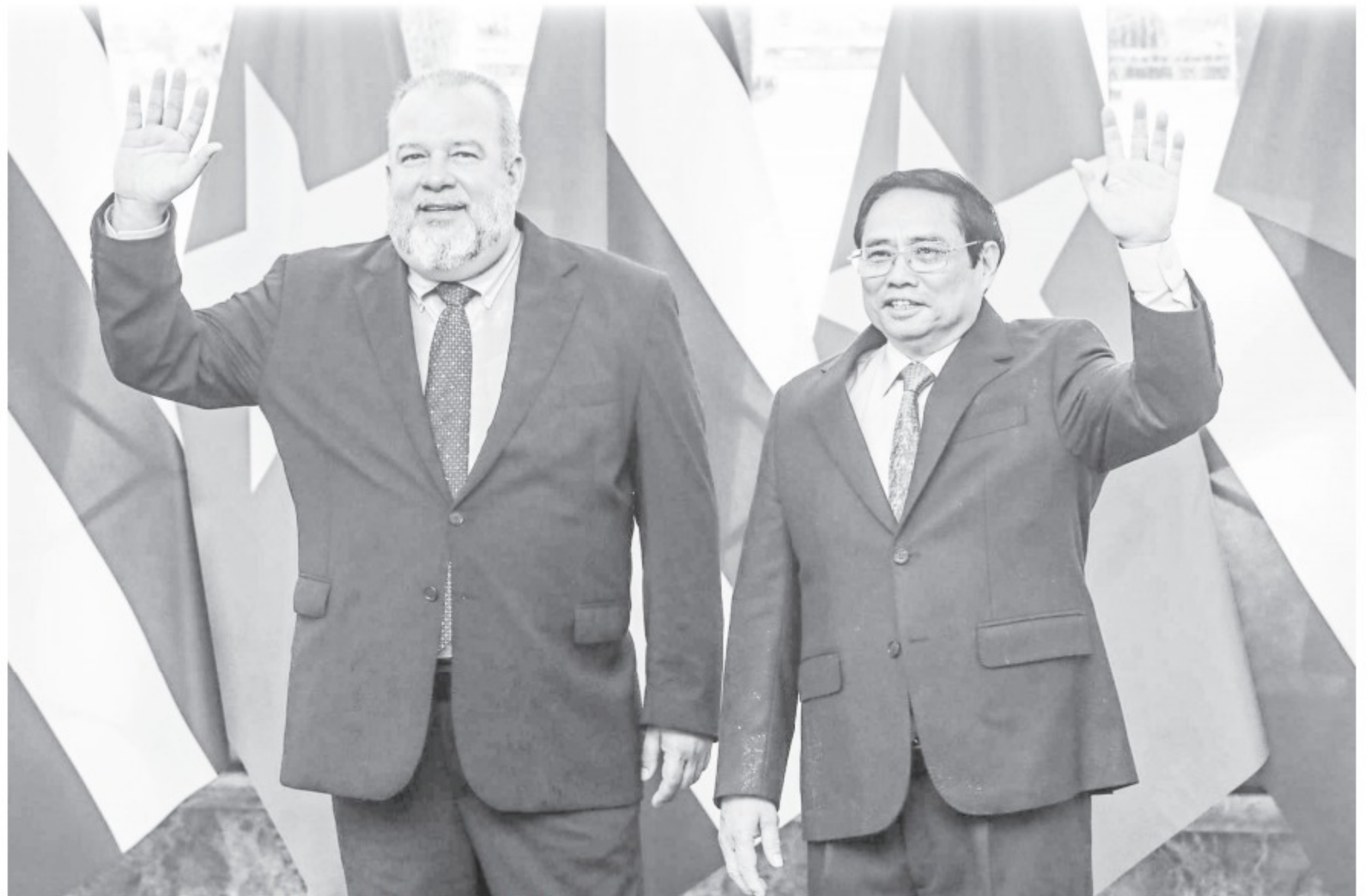
Thủ tướng Phạm Minh Chính và Thủ tướng Cuba Manuel Marrero Cruz