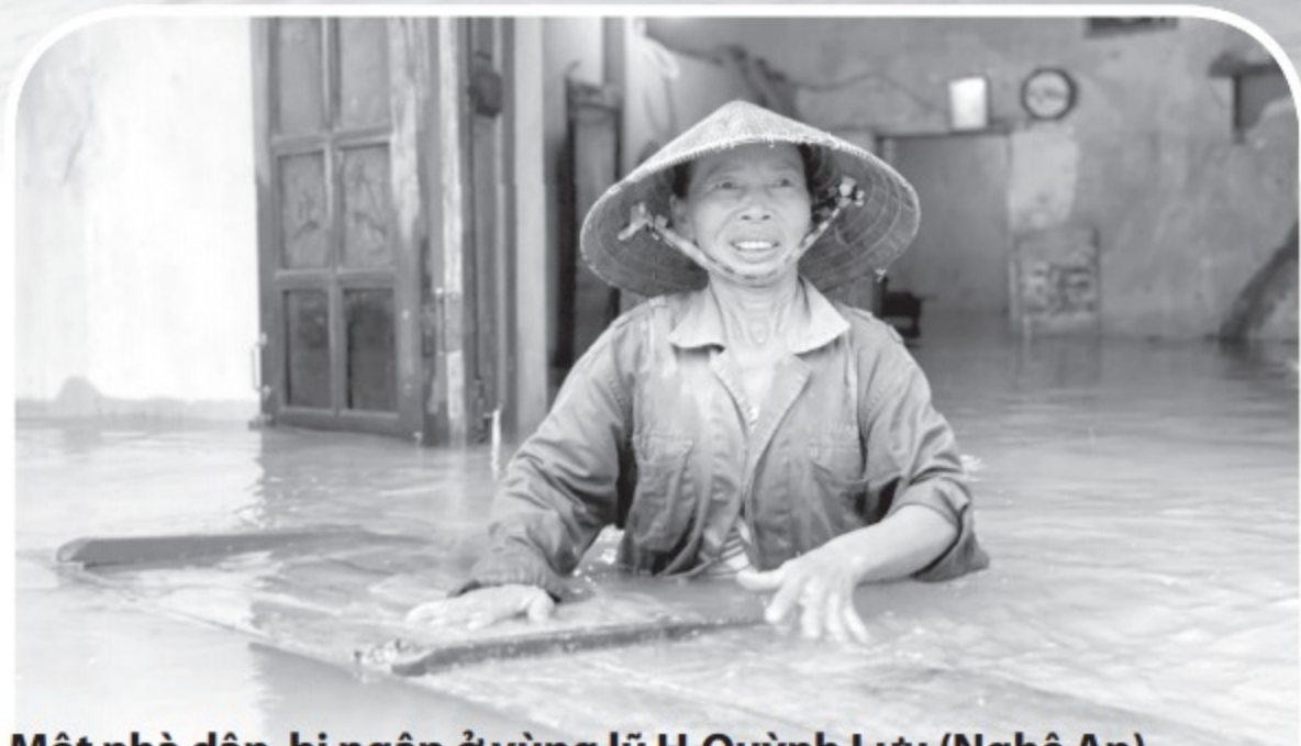
Một nhà dân bị ngập ở vùng lũ H.Quỳnh Lưu (Nghệ An)