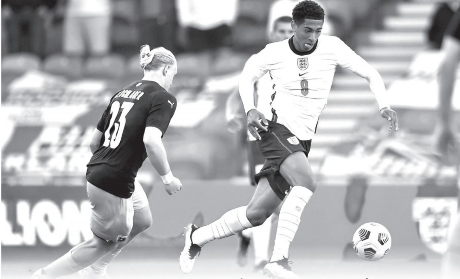
Jude Bellingham (phải) được xem là một nhân tố mới thành công của tuyển Anh