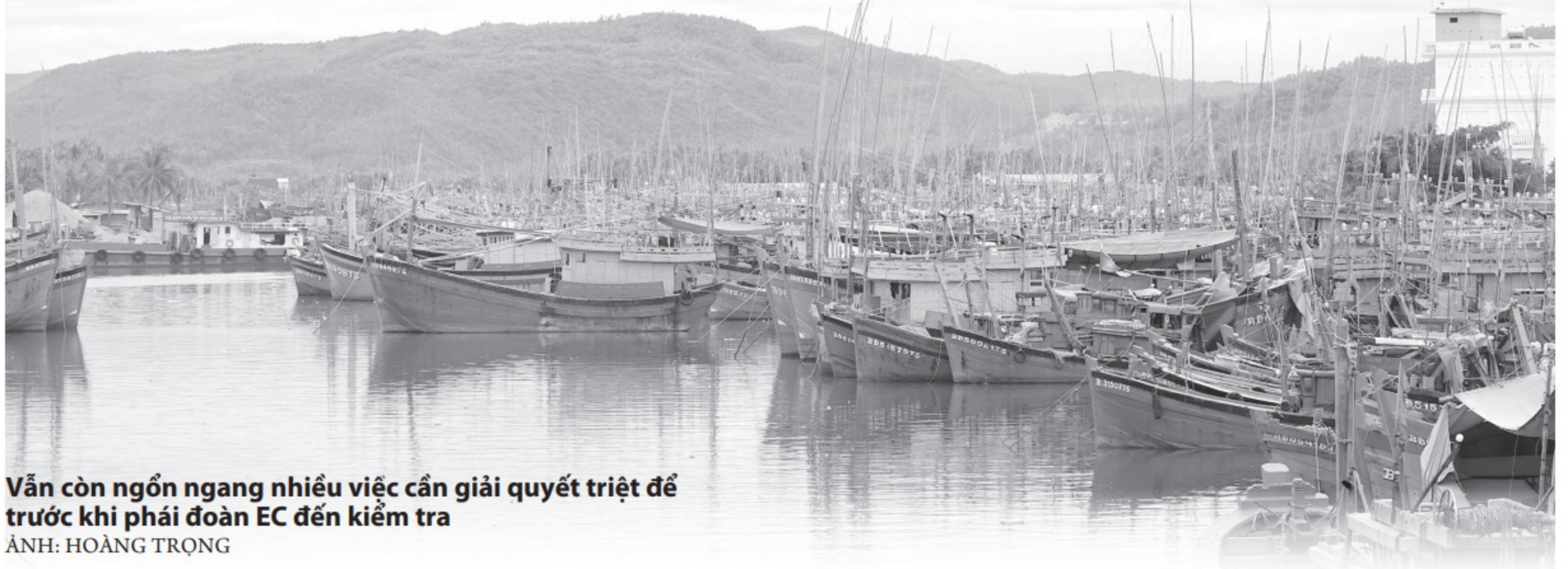
Vẫn còn ngốn ngàng nhiều việc cần giải quyết triệt để trước khi phái đoàn EC đến kiểm tra