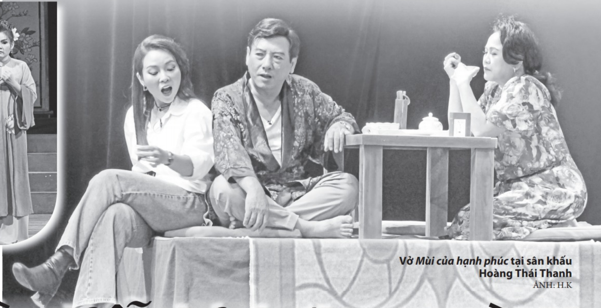
Vở Mùi của hạnh phúc tại sân khấu Hoàng Thái Thanh