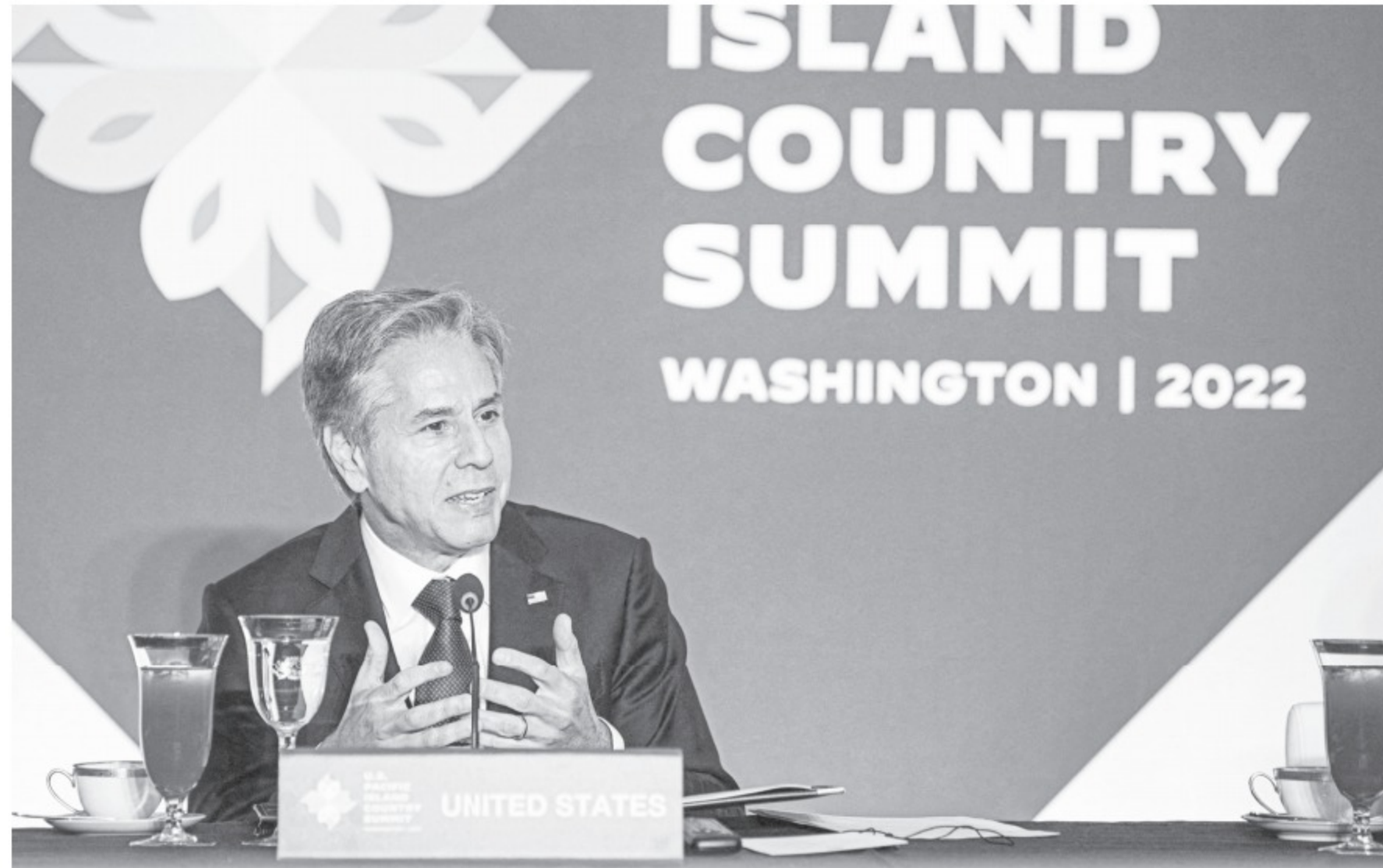
Ngại trưởng Mỹ Blinken trong hội nghị với các đảo quốc Thái Bình Dương ngày 28.9

Nhiều quan chức cấp cao của Mỹ tham gia đón tiếp và thảo luận với đại biểu của các đảo quốc Thái Bình Dương trong khuôn khổ hội nghị này, bao gồm tổng thống, chủ tịch Hạ viện, lãnh đạo Bộ Ngoại giao, Bộ Nội vụ... Phát biểu khai mạc, Ngoại trưởng Mỹ Anthony Blinken nhấn mạnh hội nghị thượng đỉnh này phản ánh quan hệ đối tác sâu sắc và lâu dài của Mỹ với các đảo quốc Thái Bình Dương, được củng cố bởi lịch sử, giá trị chung và mối quan hệ bền vững giữa người dân các bên. "Chúng ta sẽ cùng thảo luận về những thách thức đang phải đối mặt, trao đổi ý tưởng và quan điểm, đồng thời đề ra hướng đi để giải quyết những vấn đề quan trọng nhất đối với người dân", ông nói. Ngoại trưởng Mỹ cũng khẳng định đây là nỗ lực mới nhất của chính quyền Tổng thống Joe Biden nhằm trực tiếp lắng nghe những ý tưởng, ưu