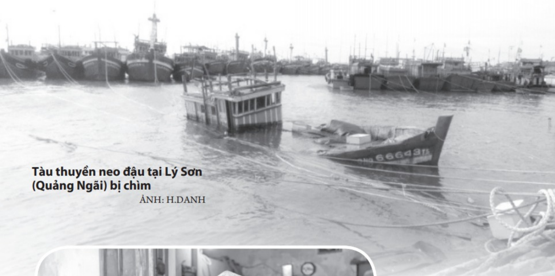
Tàu thuyền neo đậu tại Lý Sơn (Quảng Ngãi) bị chìm