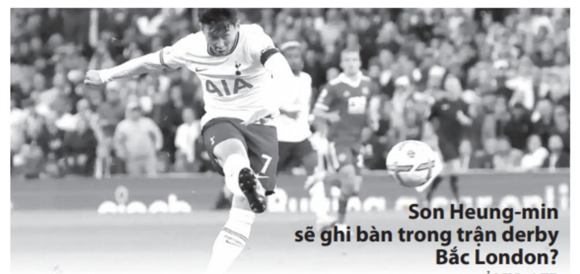
Son Heung-min sẽ ghi bàn trong trận derby Bắc London?