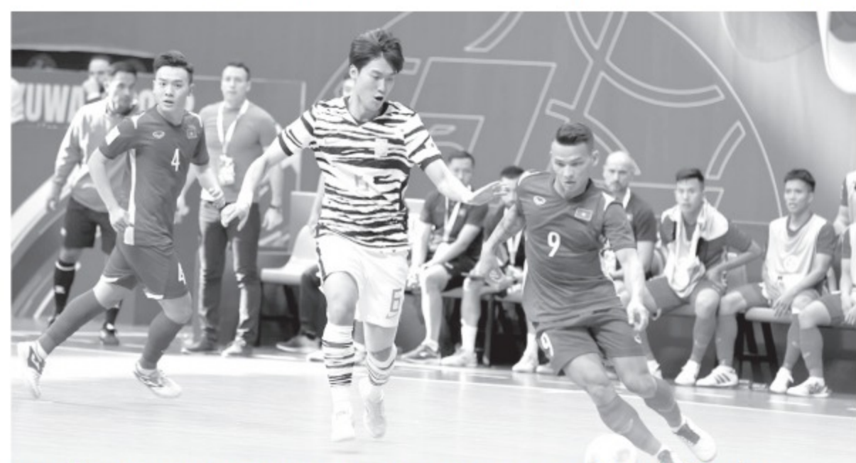
Tuyển futsal VN (phải) đủ sức chơi sòng phẳng để thắng Ả Rập Xê Út.

bị tốt cho giải đấu này. Chúng tôi sẽ không chủ quan mà sẽ chơi với thái độ tôn trọng đối thủ. Tôi tin tưởng vào các cầu thủ của mình, tất cả sẽ chơi tập trung với quyết tâm cao để tiếp tục hướng đến chiến thắng". Nếu vượt qua đội bóng Tây Á này, tuyển futsal VN sẽ nắm hơn 90% cơ hội vào tứ kết. Thành Thắng