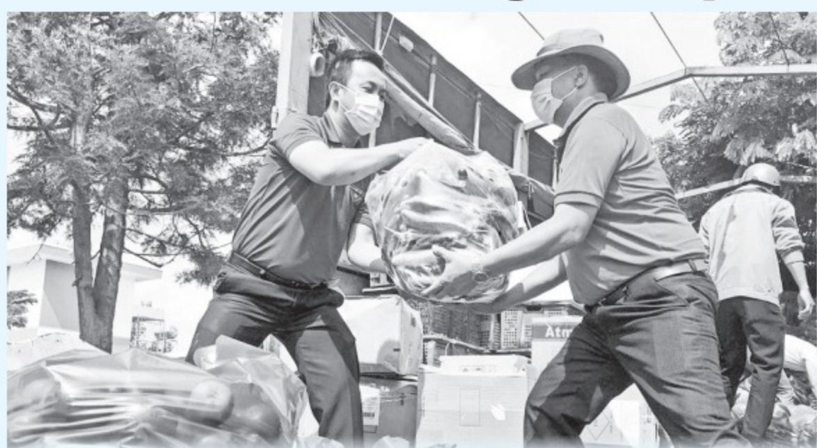
Thanh niên tham gia chống dịch Covid-19