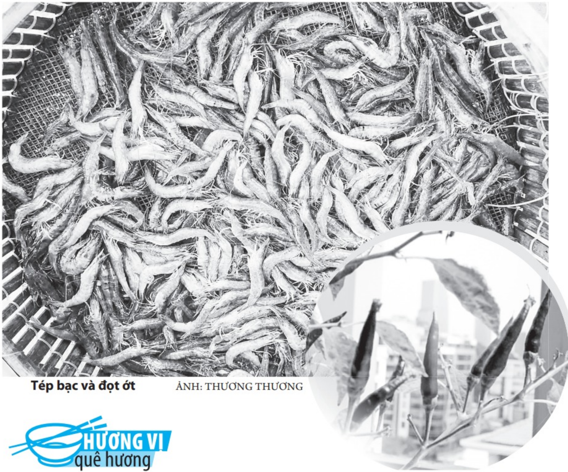
Tép bạc và đọt ớt