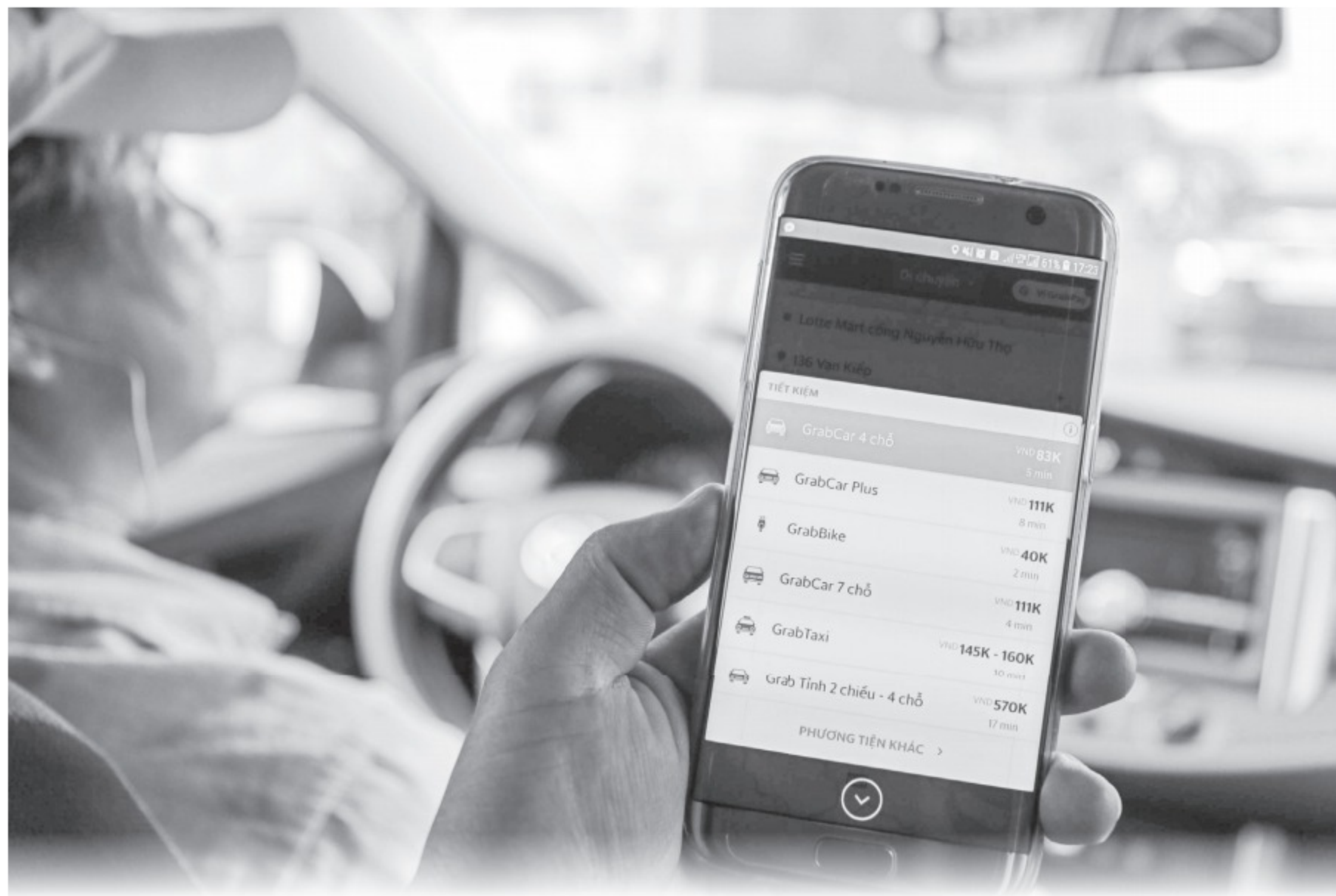
Grab - “ông lớn” công nghệ từ Singapore thống lĩnh thị trường gọi xe của VN

Theo số liệu từ Vụ Vận tải (Bộ GTVT), sau 7 năm phát triển, thị trường gọi xe trực tuyến tại VN đã có sự tham gia của 20 nền tảng khác nhau. Đến nay, có khoảng 67.000 xe taxi, 90.000 xe hợp đồng đã đăng ký kinh doanh và được cấp phù hiệu. Với doanh thu khoảng 2,4 tỉ USD trong năm 2021 và tốc độ tăng trưởng bình quân đạt khoảng 30 - 35% mỗi năm trong giai đoạn từ 2015 đến nay... thị trường gọi xe công nghệ có