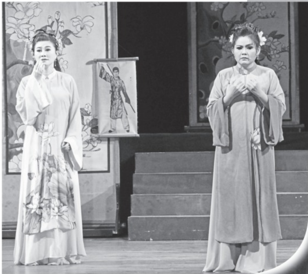
Vở Tiên Nga của sân khấu IDECAF