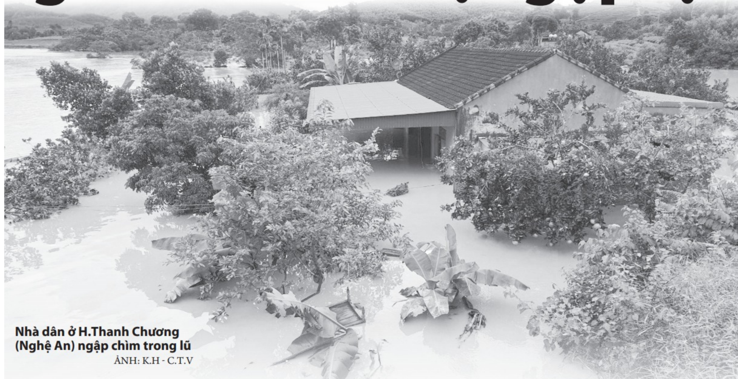
Nhà dân ở H.Thanh Chương (Nghệ An) ngập chìm trong lũ

"Mưa quá to và nước đổ về quá nhanh trong đêm khuya khiến