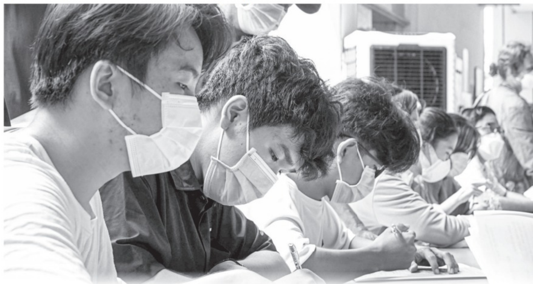
Thí sinh trúng tuyển làm thủ tục nhập học một trường ĐH tại TP.HCM