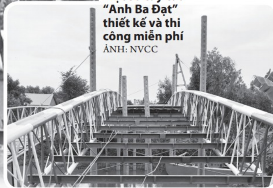
Một số cây cầu "Anh Ba Đạt" thiết kế và thi công miễn phí