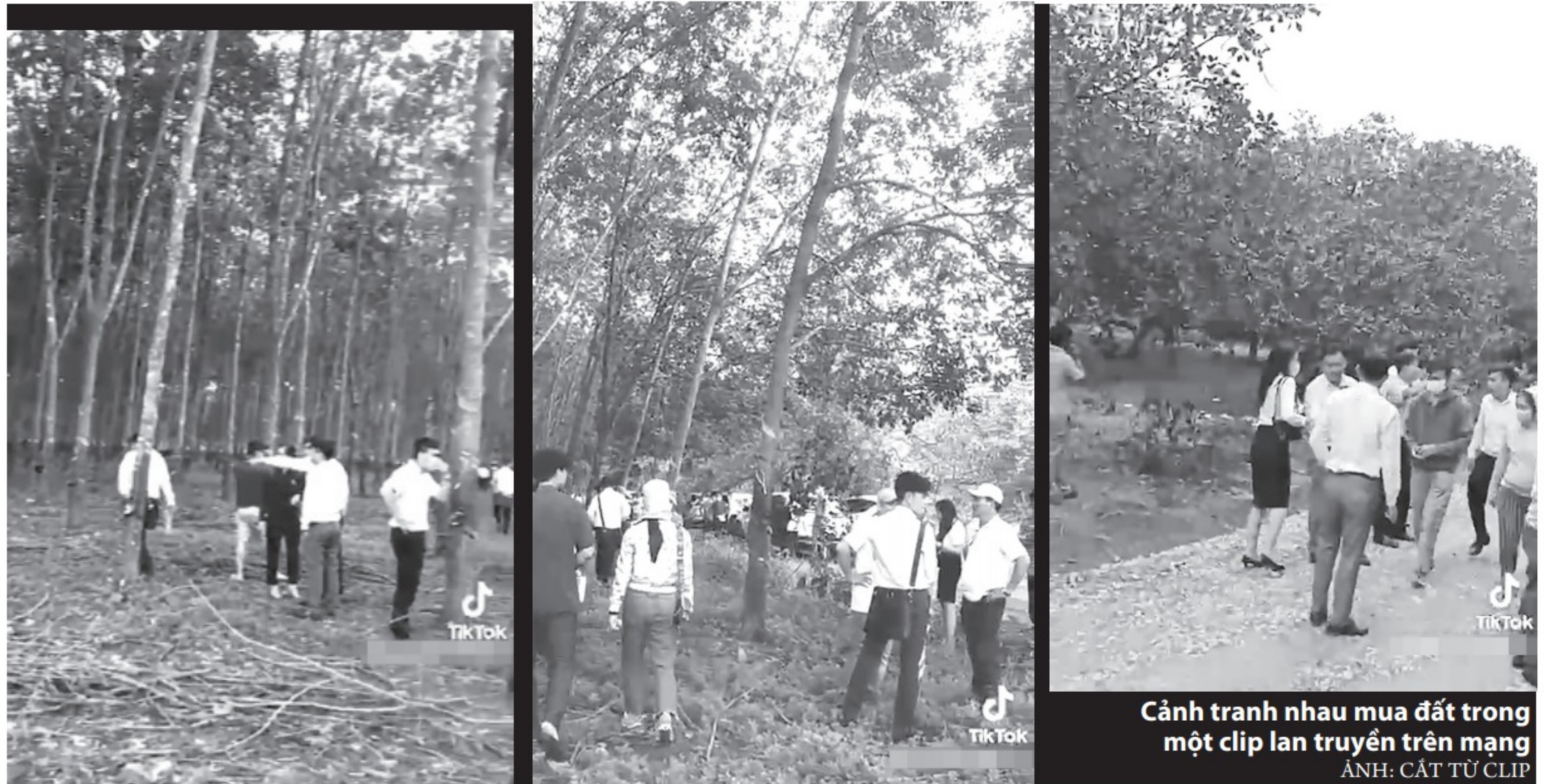
Cảnh tranh nhau mua đất trong một clip lan truyền trên mạng

Trước đó cũng tại Bình Phước, mạng xã hội xôn xao clip dài khoảng 4 phút ghi lại cảnh ở một bãi đất trống, bên cạnh con đường có rất nhiều xe ô tô đang