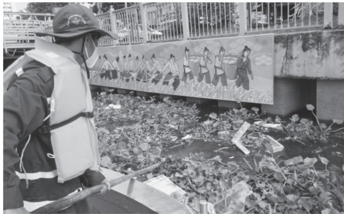
Công ty TNHH MTV Môi trường đô thị TP.HCM vớt rác trên tuyến kênh Nhiêu Lộc - Thị Nghè

Nhóm tiêu chí đầu tiên: 50% khu phố trên địa bàn phường -