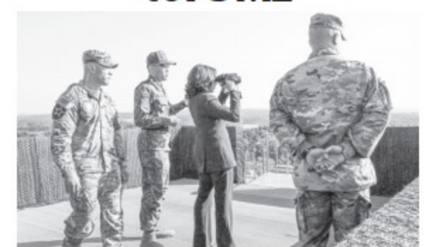
Bà Harris thăm DMZ ngày 29.9