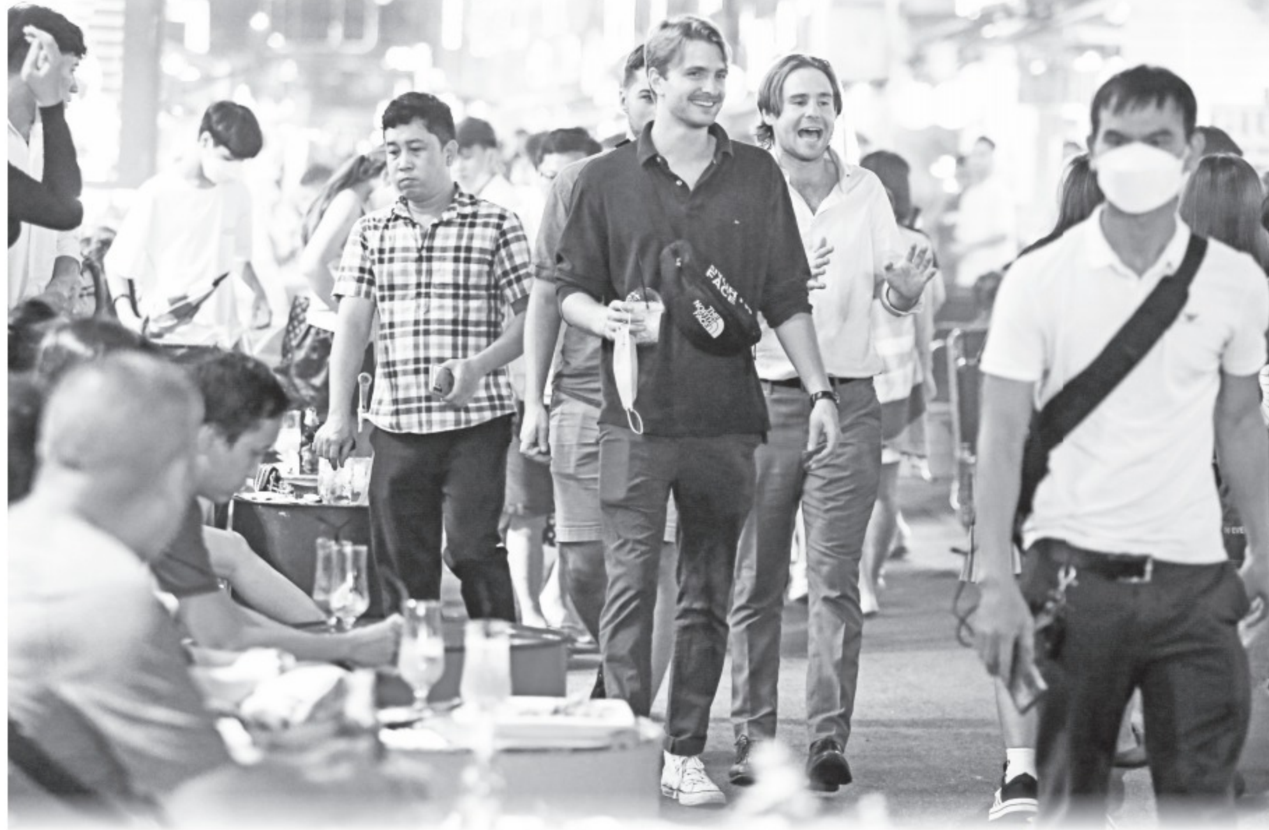
Doanh thu ngành du lịch 9 tháng năm 2022 của TP.HCM đạt hơn 89.000 tỉ đồng, tăng 126,5% so với cùng kỳ. Trong ảnh: khách đến chơi tại phố đi bộ Bùi Viện, Q.1, TP.HCM

Về giải pháp, ông Mai cho biết TP.HCM tổ chức rà soát,