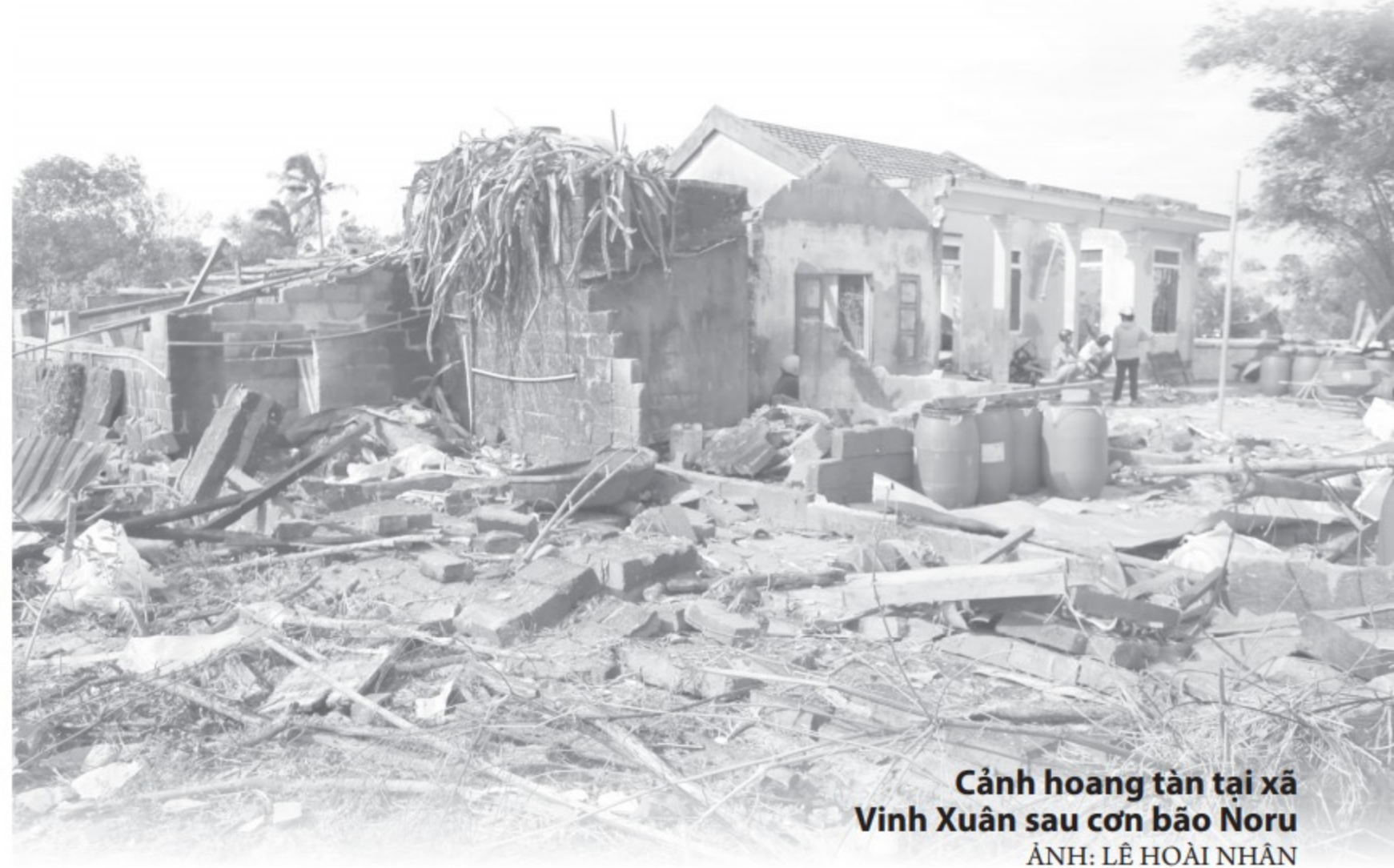
Cảnh hoang tàn tại xã Vinh Xuân sau cơn bão Noru