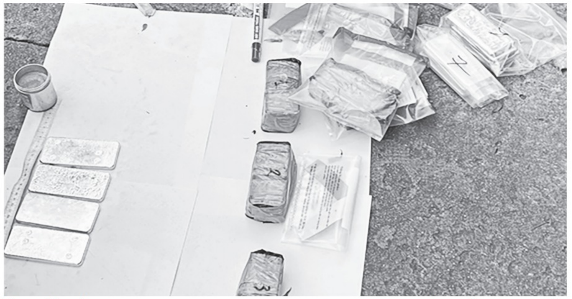
Tang vật vụ án