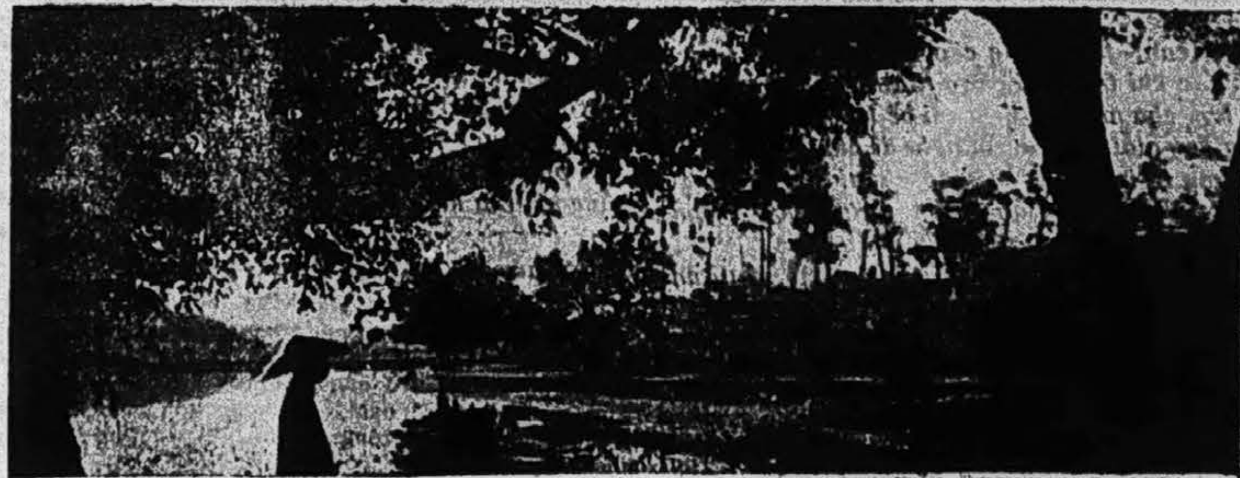
... • Đầy với giọt lệ nước sông Hương • !

Phải! Tùy theo lúc thì nó cũng không phải là cái trọng-tội, nhưng chính Xiêm-hoàng đã thừa nhận Hiến-Pháp, nói quyền cho dân, và tán-thành chế-độ hiện-thời thì sao các vị « vô-quan ấy lại » xướng-làm chỉ một cuộc phân-cách-mạng? Như vậy chẳng là trái ý của Nhà Vua lắm chăng?