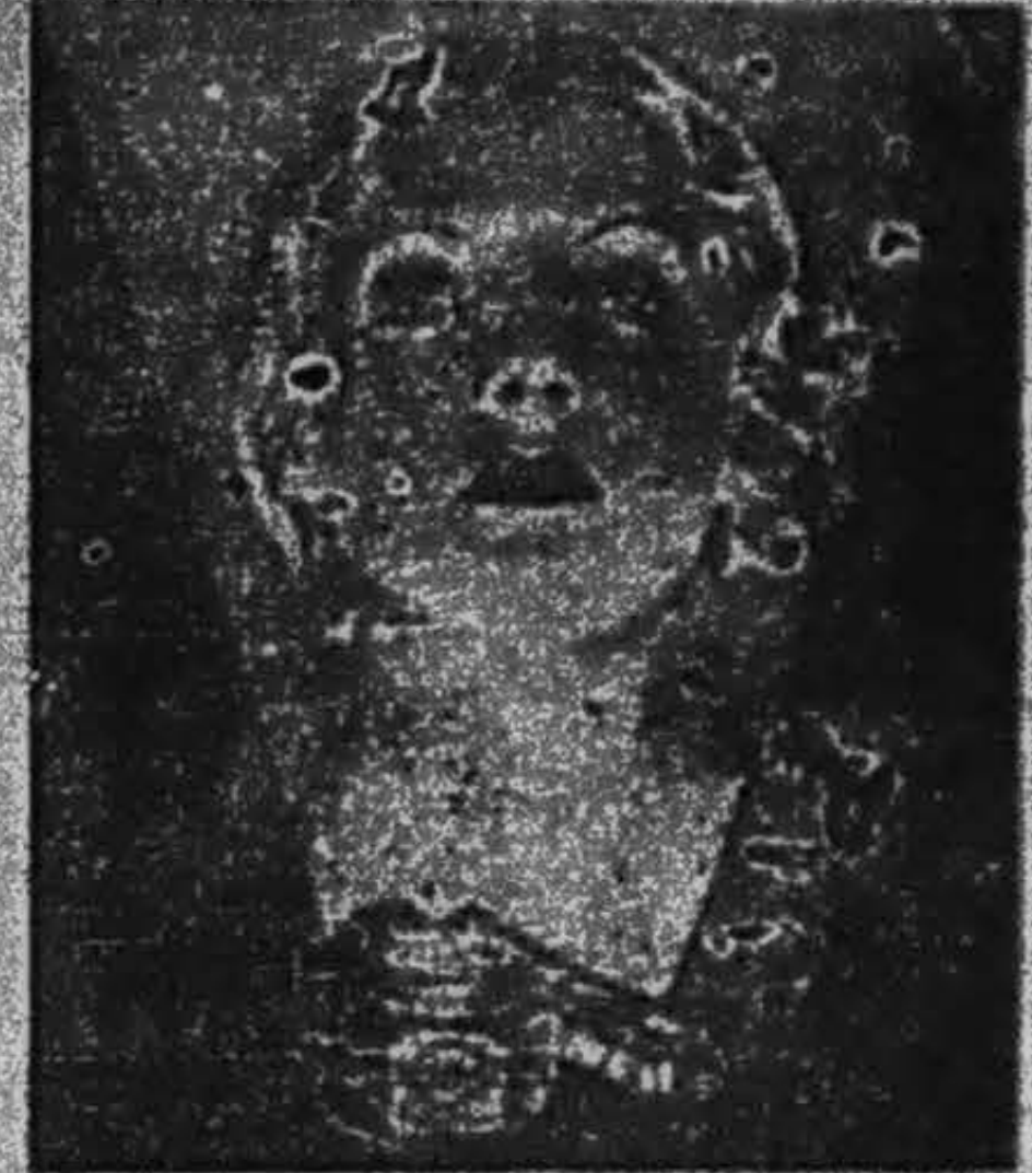
G. T. Bernard & Co

Exigez donc de votre pharmacien le produit qui remplit parfaitement toutes ces conditions :