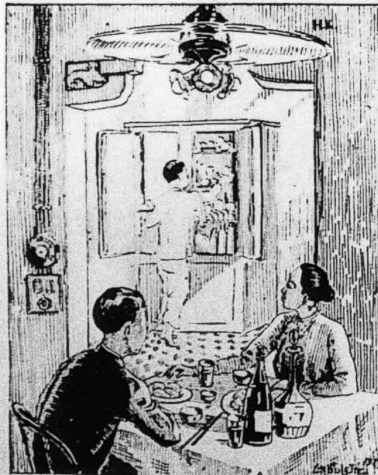
Nên dùng máy FRIGIDAIRE mà giữ gìn đồ ăn uống

Ở CÁC XỨ NONG, NHỨT LÀ XỨ ĐÔNG-PHÁP TA THÌ CÀNG CẦN PHẢI CÓ MỘT CÁI MÁY LÀM RA LẠNH ĐỂ GIỮ DIN ĐỒ ĂN UỐNG MÁY LÀM RA LẠNH HIỆU :