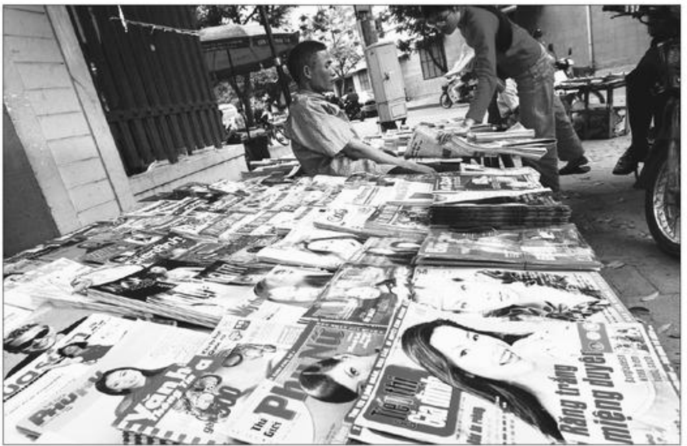
Báo chí tại Việt Nam được xem là một trong những công cụ có thể lực nhất của đảng CSVN kiểm soát người dân trong nước.

Trước hết, ông Hưng có rất nhiều tiền. Vụ án nên làm ra gần đây nhất là vụ