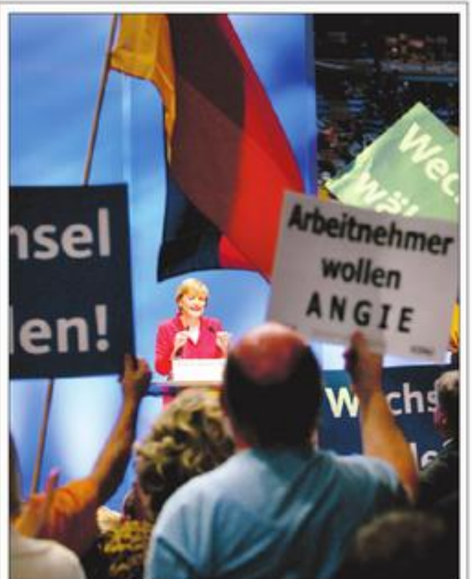
Vận động tuyển cử tại Berlin, Đức Ứng cử viên thủ tướng Đức, Angela Merkel, thuộc đảng Dân Chủ Thiên Chúa Giáo Đức (CDU), đang lên tiếng trước một cuộc tập hợp vận động tuyển cử vào ngày 16 Tháng Chín tại thủ đô Berlin. Cuộc tổng tuyển cử tại Đức dự trữ sẽ diễn ra vào Chủ Nhật này.

LONDON 16-9 (TH) - Một cuộc thăm dò dư luận cho thấy có đến 78% người dân ở Việt Nam không tin tưởng vào nhà cầm quyền và có đến 70% người dân ở Việt Nam cảm thấy không có khả năng thay đổi đời sống (cho khá hơn). Đài BBC yêu cầu tổ chức thăm dò dư luận Gallup, Hoa Kỳ, thực hiện một cuộc thăm dò toàn cầu trong đó có Việt Nam, đã cho kết quả như vậy. BBC phổ biến kết quả nói trên trong bản tin ngày Thứ Năm 15-9-2005. Cuộc thăm dò dư luận được đặt tên là "Tiếng nói của nhân dân thế giới 2005" đã phỏng vấn hơn 50,000 người tại 68 quốc gia trên thế giới. "39% người được hỏi tại Việt Nam đồng ý hoàn toàn với ý rằng: 'Tôi chẳng có thể làm được bao nhiêu để thay đổi cuộc đời'; 31% khác thì đồng ý với nhận định này; 14% lưỡng lự không biết nên đồng ý hay không. Chỉ có 8% là hoàn toàn bác bỏ và 5% là bác bỏ ý kiến bi quan." Bản