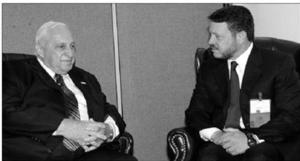
Quốc Vương Abdullah II của Jordan đã gặp gỡ và hội đàm với Thủ Tướng Ariel Sharon của Israel bên lề Hội Nghị Thượng Đỉnh Liên Hiệp Quốc tại New York vào hôm 16 Tháng Chín. Vua Jordan khuyến khích Israel hãy rút lui thêm khỏi các vùng đất hiện do họ chiếm đóng tại Tây Ngạn để dọn đường cho việc thành lập nước Palestine.