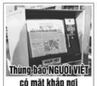
Thùng/bảo NGƯỜI VIỆT có mặt khắp nơi

"Quả thật Hama quỳ lạy được y như một tăng sĩ Phật Giáo vậy." (L.T.)