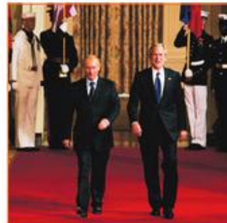
Các lãnh tụ Nga-Mỹ gặp gỡ tại Tòa Bạch Ốc Tổng Thống Hoa Kỳ George W. Bush (phải) và Tổng Thống Nga Vladimir Putin trên đường đến Phòng Phái Đồng Tòa Bạch Ốc để mở cuộc họp báo chung vào ngày 16 Tháng Chín. Hai nhà lãnh đạo đã thảo luận vấn đề ngăn ngừa vũ khí nguyên tử lan tràn và cứu trợ của Nga dành cho nạn nhân bão Katrina.

Một tháng trước đây, chúng ta không thể, không dám tưởng tượng sẽ có một thành phố lớn ở Mỹ bị chìm dưới ba mét nước, tất cả dân chúng được lệnh tản cư. Chuyện đó mới xảy ra tuần trước. Bây giờ mọi người đều hỏi: Nước Mỹ có chuẩn bị sẵn sàng để đối phó với một thiên tai hay tai họa do con người gây ra với hậu quả lớn tương tự hay không? Nói riêng tiểu bang California, chính quyền và dân chúng đã sẵn sàng chưa? Sau trận bão Katrina, tuần báo Businessweek viết một chủ đề ghi trên bìa: Tai họa lớn sắp tới (The Next Big One) để báo động cả nước Mỹ phải đề phòng. Báo này đưa ra ba thí dụ: Động đất lớn ở California; Cúm gà lan truyền tới Chicago; và "bom bẩn" tung phóng xạ ra một vùng trong thành phố New York. Trong ba tai họa giả tưởng đó, California có vẻ là nơi đã được chuẩn bị kỹ nhất để đương đầu với động đất. Giản dị, vì tiểu bang này đã "tập trận" nhiều lần, qua những cuộc động đất trước đây. Liệu có một trận động đất lớn sẽ xảy ra ở California hay không? Ở đâu? Bao giờ xảy ra? Trước những câu hỏi về tương lai, các nhà khoa học cũng chỉ có thể