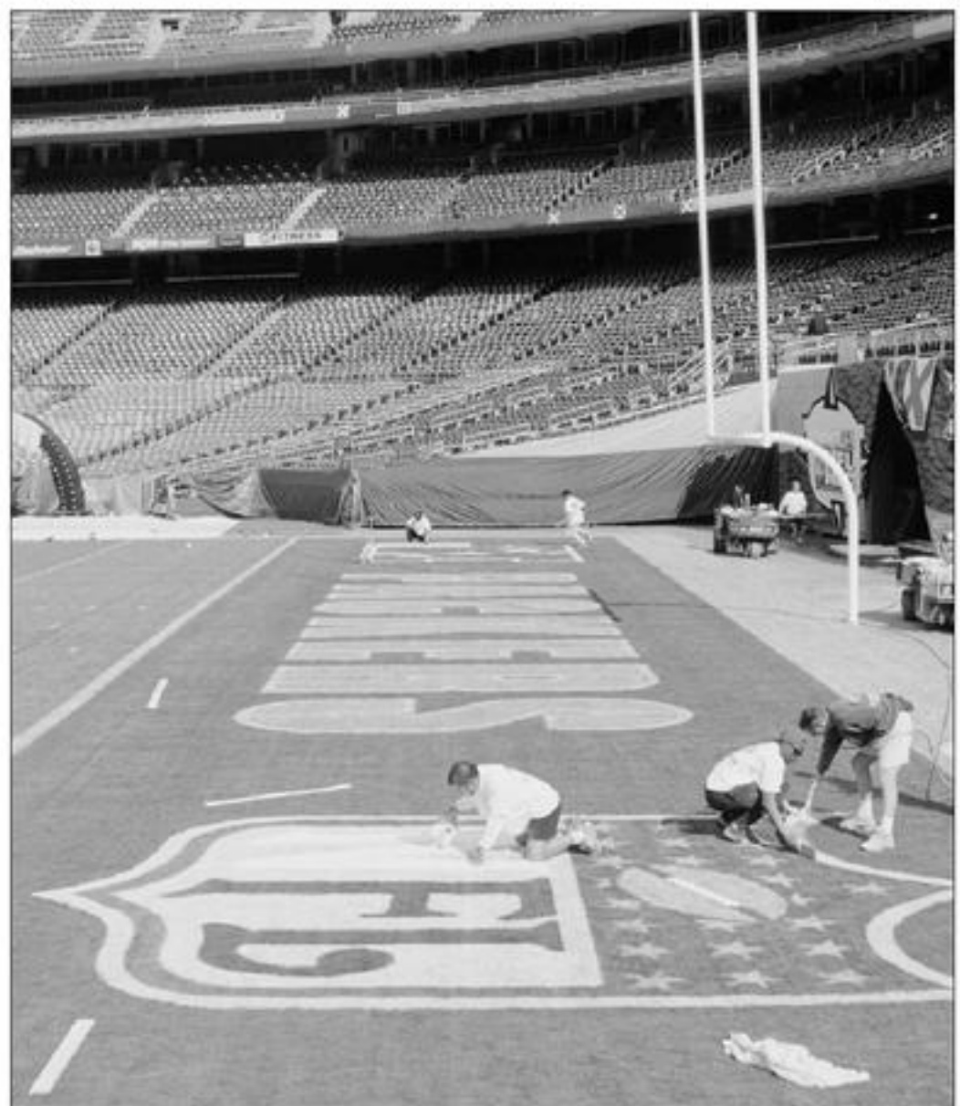
Chuẩn bị cho Super Bowl tại sân vận động Qualcomm, San Diego.

Trận Super Bowl mùa này sẽ được tổ chức vào Tháng Hai năm 2006 tại sân vận động Ford Field thuộc thành phố Detroit. Còn trận 2008 sẽ được tổ chức tại một sân vận động đang xây ở ngoại ô thành phố Phoenix, AZ. ■