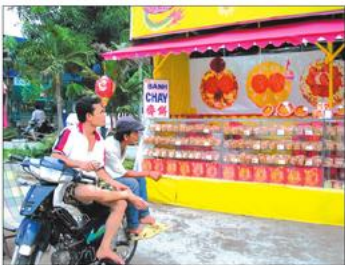
Đèn Trung Thu bán ở lễ đường có xuất xứ từ Trung Quốc.

Bánh Trung Thu Vài năm trở lại đây, bánh trung thu của tiệm bánh Kinh Đô có chiều hướng lấn át các thương hiệu bánh trung thu tại Sài Gòn. Đặc biệt năm nay, đi bất cứ khu phố nào, các chợ lớn, nhỏ khắp Sài Gòn, gian hàng bán bánh trung thu Kinh Đô nổi trội hơn hết, với số lượng bánh nhiều hơn tất cả. Thương hiệu bánh Kinh Đô "sinh sau đẻ muộn", xuất hiện chừng mười năm nay, nhưng ngày càng được tín nhiệm, với nhiều chủng loại bánh kẹo, mở nhiều cửa tiệm tại nhiều đường phố lớn, các khu vực kinh doanh thương mại sầm uất của thành phố. Cùng thời với Đức Phát, một thương hiệu đã nổi tiếng tại Sài Gòn và nhiều tỉnh thành khác, nhưng xem ra, sức triển của thương hiệu bánh Kinh Đô ngày càng mạnh và bền vững hơn. Tung hoành thị trường bánh trung thu trong năm nay, cũng như những năm trước, bánh trung thu Đồng Khánh muốn chạy đua với bánh trung thu Kinh Đô. Là một thương hiệu đã ra đời từ lâu trước 30-4-1975, bánh trung thu Đồng Khánh in đậm trong trí nhớ của dân Sài Gòn (Chợ Lớn), nên khi nói đến bánh trung thu, người ta nhớ liền tới bánh trung thu Đồng Khánh. Điều này cho thấy vì sao có nhiều cơ sở làm bánh trung thu "vô danh tiểu tốt" đã "án theo", "dựa hơi" thương hiệu bánh trung thu Đồng Khánh. Chúng tôi thấy, nào là Phố Thiên Đồng Khánh, Bến Thành Đồng Khánh, Bến Thành Đồng Khánh... tất nhiên tên thật thì in chữ nhỏ, tên "dựa hơi" thì in chữ lớn, kiểu chữ giống hệt như thương hiệu của "bốn quán chánh hiệu có cầu chứng tại tòa!" Các thương hiệu bánh