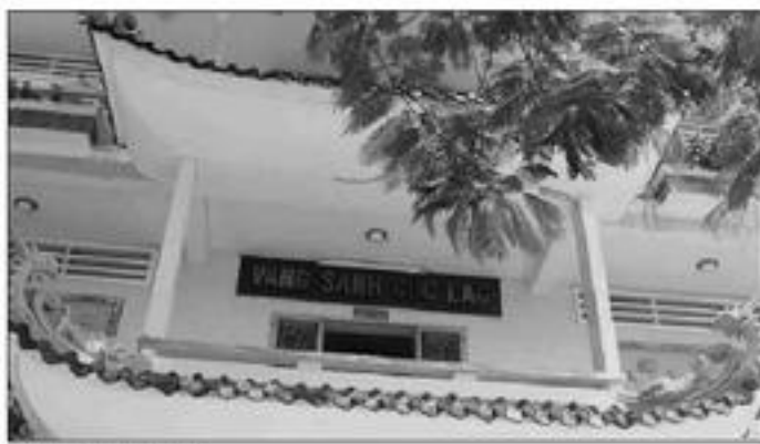
Nhà vàng sanh.