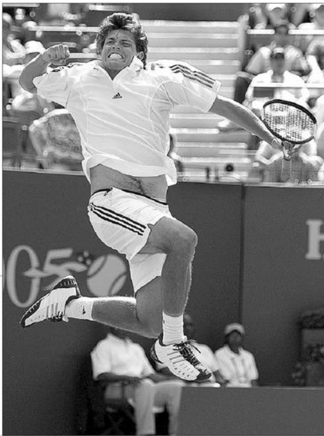
Taylor Dent, một trong những bốn niềm hy vọng còn lại của Mỹ trong giải đơn nam, vui mừng nhảy cẫng lên sau trận thắng Nicolas Almagro người Tây Ban Nha, 6-3, 6-2, 4-6, 7-5.

Các đấu thủ Mỹ không chỉ bị loại khỏi giải đơn nam. Tính chung giải Mỹ Mở Rộng, theo thống kê của ban tổ chức, Mỹ có 41 đấu thủ tham gia, nay chỉ còn 8. (H.N.V.)