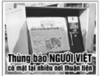
Thùng bảo NGƯỜI VIỆT có mặt tại nhiều nơi thuận tiện

Đến 28 tháng 8, 11 người trong đường dây đã bị bắt. Đây cũng là một vụ án làm giả giấy tờ, hộ chiếu lớn nhất được phát hiện ở Hải Phòng từ trước đến nay.