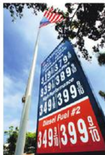
Giá xăng vọt tăng sau thiên tai bão lụt

Bão Katrina đã gây nên những hậu quả kinh tế và xã hội khôn lường chẳng những cho cư dân tại các tiểu bang duyên hải Vịnh Mexico mà còn cho toàn thể đất nước Hoa Kỳ nữa. Đây là giá biểu xăng tăng cao chưa từng thấy trong ngày 2 Tháng Chín tại một trạm xăng ở La Jolla, California, thuộc tây bộ Hoa Kỳ.