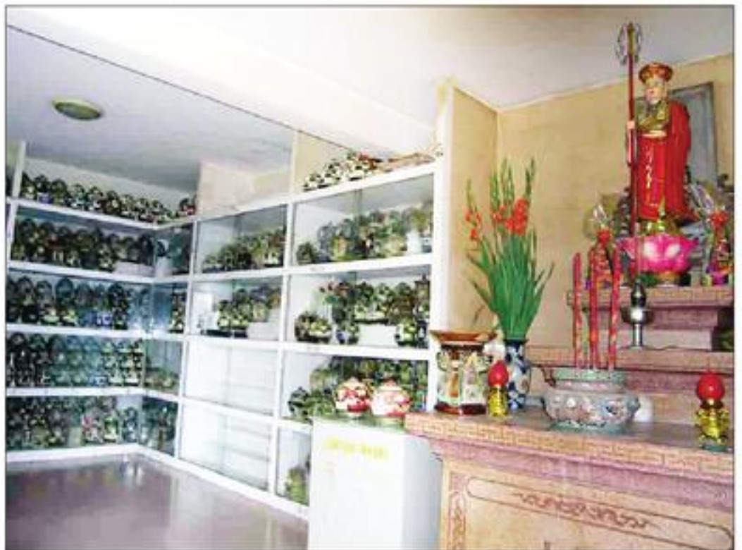
Kệ giữ cốt.

Ông và cái hũ cốt của ông anh vừa thoát cảnh chen lấn thì lại rơi ngay vào nạn "quan liêu" ở chùa. Sau nhiều giờ