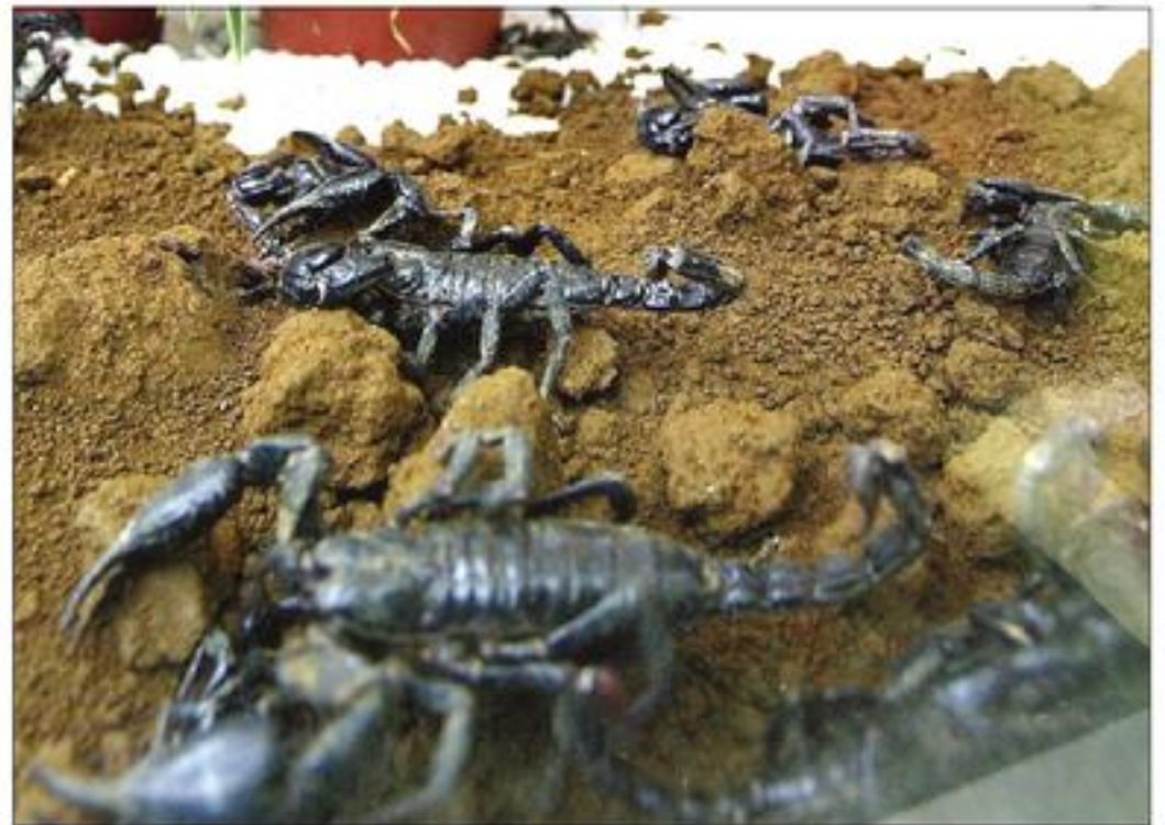
Mỗi con bò cạp núi này có giá từ 3,000 đến 4,000 VND/con.

Báo này mô tả: "Nếu chưa lần nào nhìn thấy con đuông, chắc hẳn người ta sẽ phát hoảng khi thấy nó thun thun, ngoác qua ngoác lại như con sâu. Thế nhưng, nó lại là món khoái khẩu của không ít người, đặc biệt là dân nhậu. Chị Phương, người bán đuông tại chợ Bến Thành, đưa tay vớt một con đuông chà là vàng úm từ trong thau nước cầm trên tay nói: "Vây chứ mấy ông nhậu kiếm không ra. Còn mấy ông, mấy bà người Hàn Quốc thì ghiền còn hơn sữa tươi nữa đó".