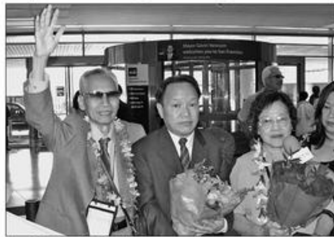
Ông Hoàng Minh Chính trong những giây phút đầu tiên đến Hoa Kỳ.

Con người kiên cường, bất khuất trước uy vũ, 26 năm tù đầy (cả thời Tây lẫn thời ta), nguyên tổng thư ký Đảng Dân Chủ VN, nguyên viện trưởng Viện Triết học Mác-Lênin, từ nhiều năm nay đã trở thành biểu tượng cho công cuộc đấu tranh dân chủ tại Việt Nam; và hệ quả đã trở thành cái gai trong con mắt nhà cầm quyền, chỗ ở luôn luôn bị bao vây, gây hải hùng cho những ai muốn đến thăm hỏi, đi đâu cũng bị bám sát 24/24; ấy thế mà vừa rồi cụ Hoàng Minh Chính lại được đi Mỹ.