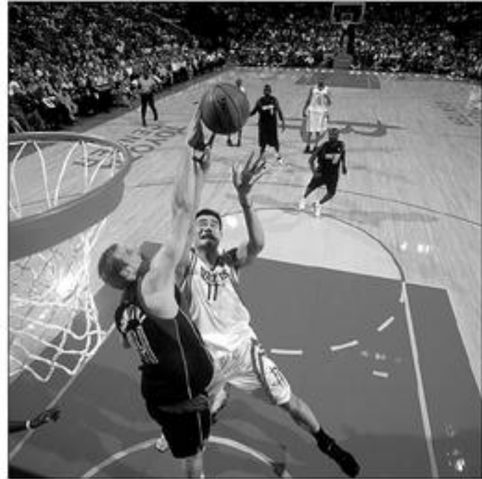
Cầu thủ Yao Ming áo số 11 đội Houston Rockets giành danh giải vô địch Á Châu. Đấu trong liên đoàn NBA năm qua, mỗi trận Yao Ming ghi bàn trung bình 18.3 điểm, giành danh rebound 8.4 lần, và block phá bóng 2 lần. Nếu tính cả 3 năm trong NBA, Yao ghi bàn trung bình 16.4 điểm và rebound 8.5 lần.

Hiện nay Yao đang ở Bắc Kinh tập với đội tuyển quốc gia Trung Quốc chuẩn bị giải vô địch Á Châu. Đấu trong liên đoàn NBA năm qua, mỗi trận Yao Ming ghi bàn trung bình 18.3 điểm, giành danh rebound 8.4 lần, và block phá bóng 2 lần. Nếu tính cả 3 năm trong NBA, Yao ghi bàn trung bình 16.4 điểm và rebound 8.5 lần.