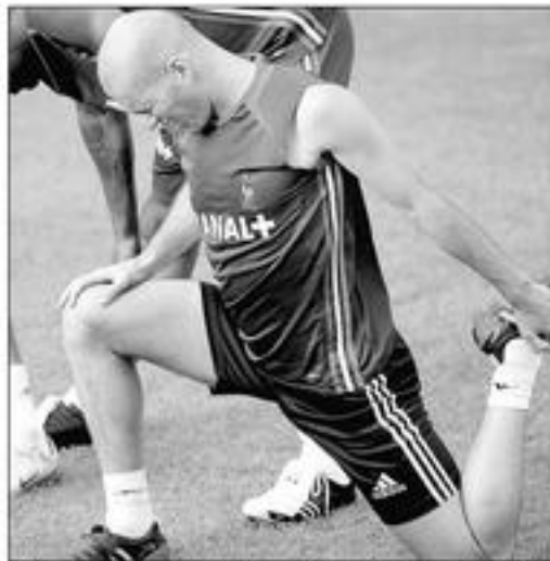
Zinedine Zidane trong buổi tập huấn hôm 2 Tháng Chín, trước ngày gặp đội tuyển Faroe Island trên sân Lens, Pháp.

Người Pháp vẫn nhớ rất rõ về hai lần thi đấu của họ tại vận động trường Lens. Họ đã bại được đội tuyển Paraguay 1-0 với một bàn thắng bằng vàng trong một trận đấu quyết liệt ở vòng nhì của Giải Vô Địch Bóng Tròn Thế Giới 1998, và họ cũng đè bẹp được đội Malta với tỷ số 6-0 trong một trận đấu ở vòng loại của Giải Vô Địch Âu Châu vào năm 2004. (V.P.)