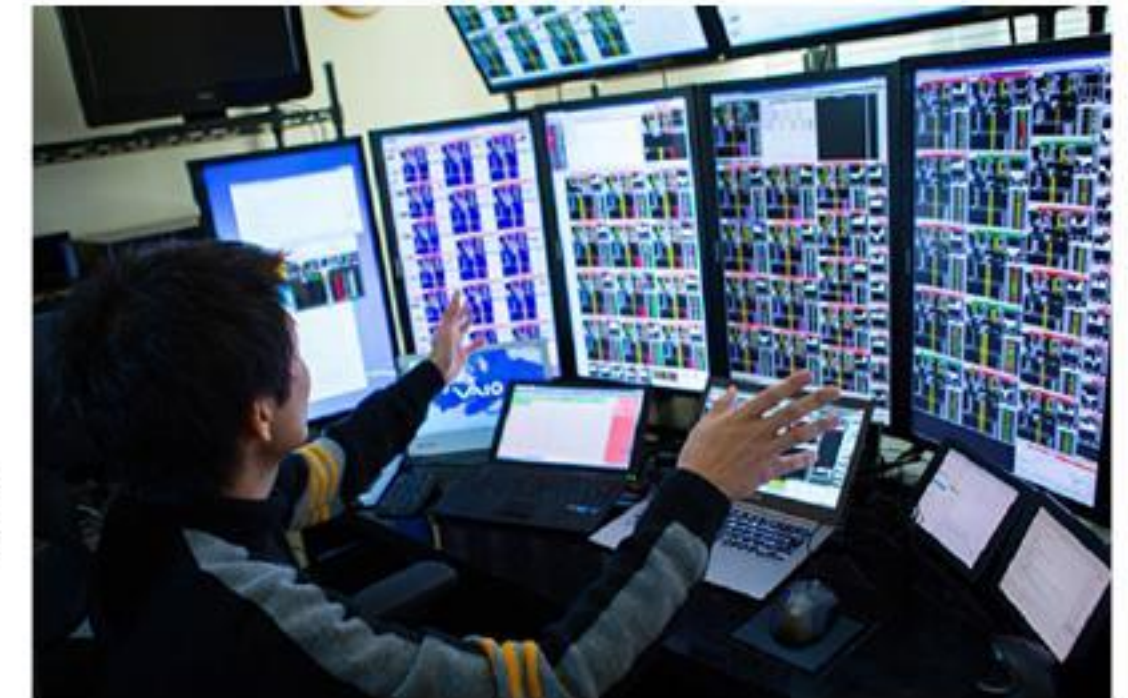
CIS đang mô tả cách anh theo dõi thị trường chứng khoán

Thay vào đó, anh chỉ lắng nghe tin tức từ các diễn đàn, chăm chú theo dõi bảng điện tử trên sàn chứng khoán để đoán biết xu hướng của thị trường. Nguyên tắc của anh chỉ có một: Mua cổ phiếu đang được mua và bán cổ phiếu đang được bán.