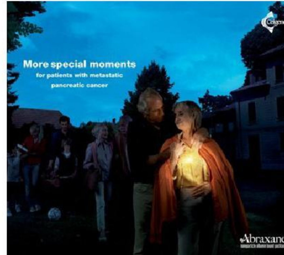
Poster quảng cáo Abraxane - loại thuốc làm nên danh tiếng của Patrick.

"Đừng đánh giá thấp Soon Shiong. Sâu thẳm trong tim, người đàn ông này hiểu rõ danh hiệu giàu nhất thế giới không phải là một tấm séc để dùng vỗ vờ, mà là để phục vụ cho mục đích cao nhất là cải thiện nền y học thế giới. Chỉ cần một phần nhỏ trong bức tranh viễn cảnh mà Soon Shiong vẽ ra trở thành sự thật cũng đã đủ khiến cuộc sống của chúng ta tốt đẹp hơn rất nhiều rồi". [ ]